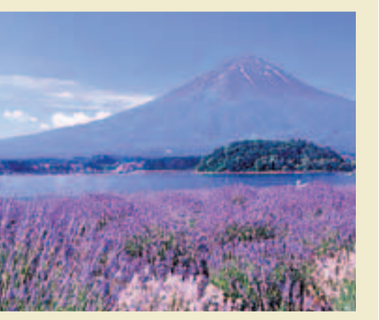
伊犁河谷的薰衣草。網上圖片