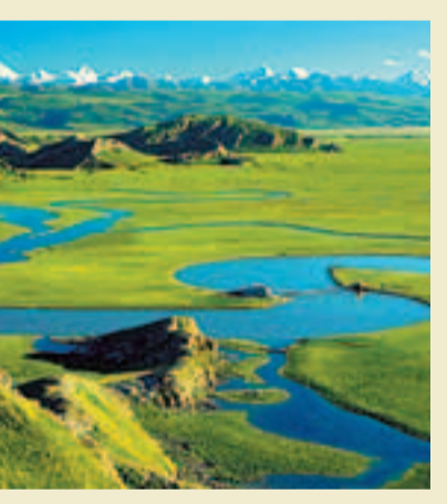
伊犁河谷風光。網上圖片