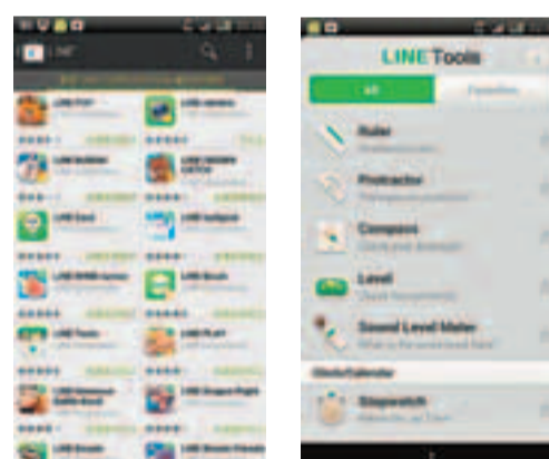
■ 開發Line的公司與不同遊戲程式合作，推出不同遊戲提升開發商的知名度。

應用程式不單單是一個個體，透過應用程式之間的連結進入生活不同部分，當中以Line的開發公司最為積極，不單追加不同種類遊戲與朋友一拼高低，更可向他們「索命」、「索道具」過關。而另一方面Line更整合不同日常常用的小工具至Line Tools，一站式解決日常生活的問題，相比MSN單一的聊天功能，更能夠即時支援到用家日常生活的需要。