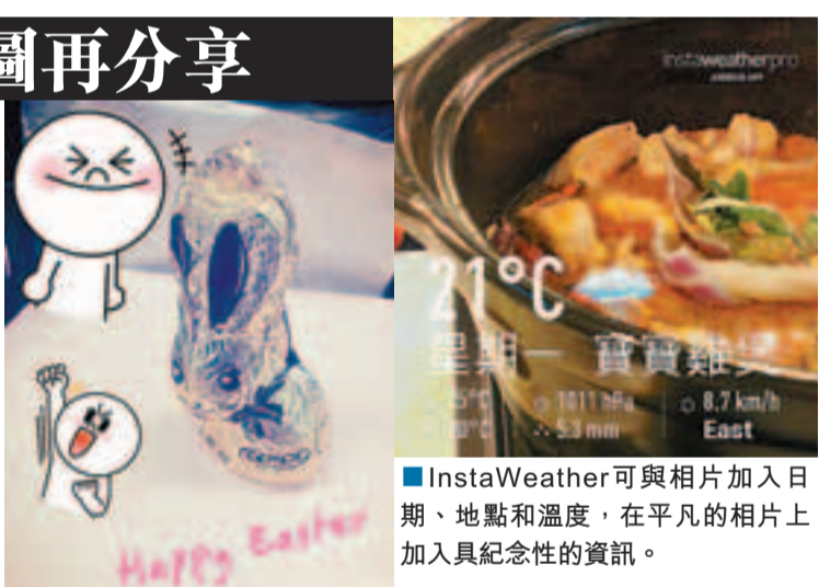
■ 透過Line Camera用家可於相片上加入不同趣致圖案，在相片表達個人情感。

以往透過MSN分享相片往往要等接收人在線才可以進行，而智能電話就可以在拍攝後立即傳送分享。另一方面，智能電話的應用程式更將以往在電腦上視為困難事的P.S. (Photoshop) 改圖工序，由複雜的選項變成簡單的點擊和拖動動作，只要用家花心機的話定能做出令人驚艷的相片，就例如相片分享程式Instagram、InstaWeather，甚至Line追加程式Line Camera。而發布之後快速得到其他的「Like」和留言，亦會化成動力讓用家下次繼續花心思創出個人風格的相片。