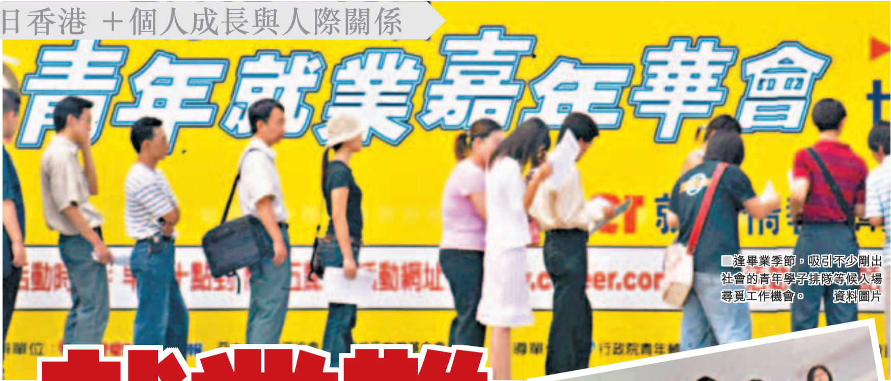
逢畢業季節，吸引不少剛出社會的青年學子排隊等候入場尋覓工作機會。 資料圖片