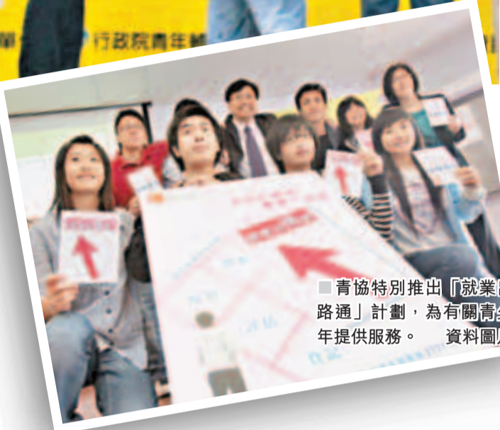
青協特別推出「就業出路通」計劃，為有關青少年提供服務。 資料圖片