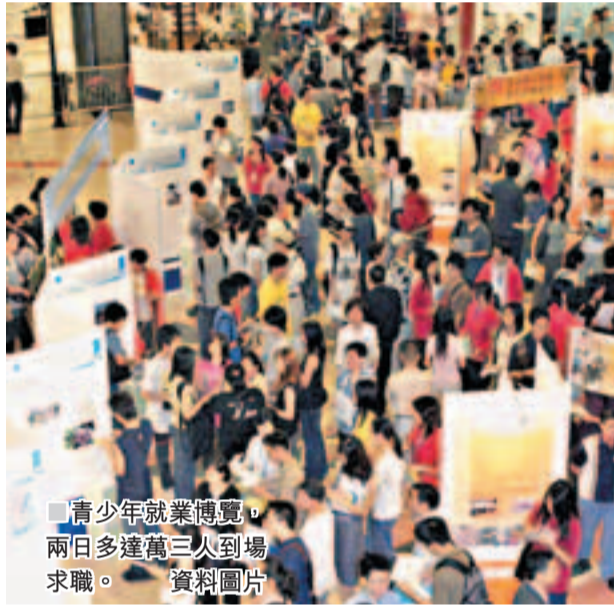
青少年就業博覽，兩日多達萬三人到場求職。 資料圖片