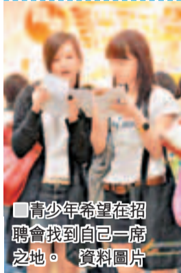
青少年希望在招聘會找到自己一席之地。 資料圖片

接着是「探究三部曲」的第一步：搜尋資料。最方便的做法是在網上以關鍵字「青少年失業率」進行搜索，彈指之間，網頁上列出超過130萬條搜索結果。這時，碰上網絡世界的恒久問題：「資料太多、訊息爆炸，不知如何選擇！」