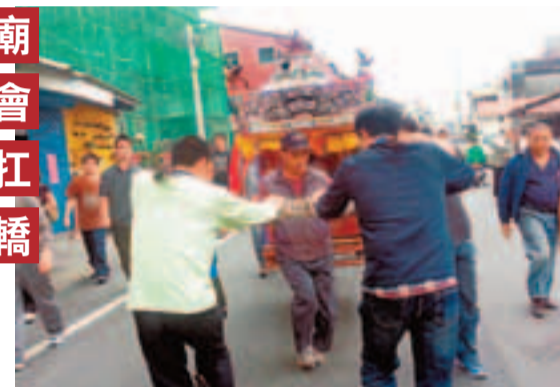
台南市政府觀光旅遊局配合即將登場的下營上帝廟繞境活動，7日在下營區舉辦香科體驗活動，讓民眾體驗扛轎及陣頭繞境。