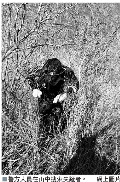
警方人員在山中搜索失蹤者。