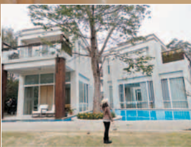
■八角居所主建築的外觀崇尚極簡風格，純白典雅。獨特另類的扇形排列，巧妙的分割成一棟主建築及兩棟附屬且相連的建築，與各個建築相連在一起的景觀池看以靜謐，宛如鏡子的水面與天空的湛藍連成一氣。建築旁各有高聳的樹木陪襯，添雄偉氣勢。