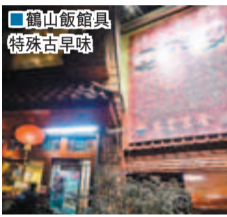
■鶴山飯館具特殊古早味