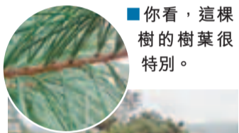
■你看，這棵樹的樹葉很特別。