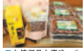
■台館鄉是台灣唯一生產紅棗的地方，所以買紅棗乾作為手信，是不錯的選擇。