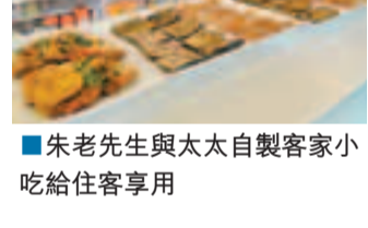
■朱老先生與太太自製客家小吃給住客享用