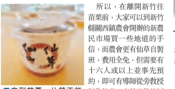
■來到苗栗，仙草不能不吃。

《本草綱目》記載，仙草茶清涼解渴、降火氣、消除疲勞，老少皆適宜，關西鎮位於新竹縣之東北方，四季溫和，風景秀麗，沒有污染，水質甚佳，適合仙草之生長，故素有「仙草故鄉」之稱。這兒仙草系列產品均採用關西仙草萃取而成，不含人工甘味、色素、防腐劑，能安心食用。