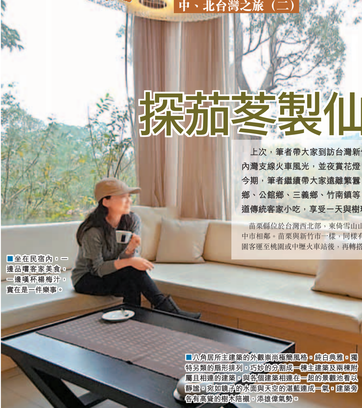
■坐在民宿內，一邊品嚐客家美食，一邊嘆杯楊梅汁，實在是一件樂事。