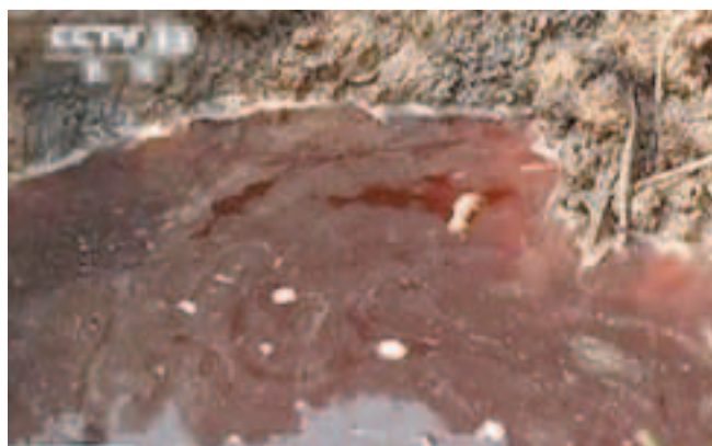
河北滄縣地下水日前變成了紅色，近800隻雞鴨後死亡。網上圖片

河北滄縣張官屯鄉小朱莊的地下水日前變成了紅色，近800隻雞鴨後死亡。村民連400米深的井水也不敢喝，因為也是粉紅色的，做飯只能用純淨水。該村方圓5公里內只有一家建新化工廠，生產染料中間體。這個化工廠雖已停產，但廠區內還有一些顏色很深的工業廢水。對此，鄧連軍稱該廠排放達標，表示「紅色的水不等於不達標的水」，他甚至用「水煮紅豆也會紅」來解釋。