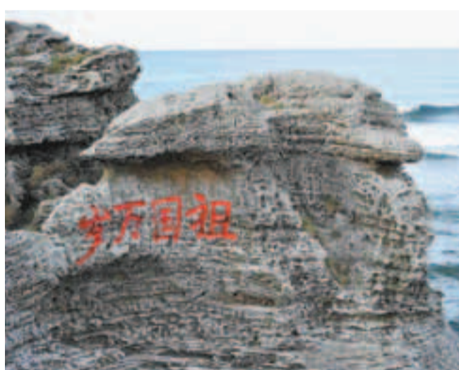
西沙永興島上刻着「祖國萬歲」的石頭。

另外，三沙加強海洋環境保護，從加強保護區建設，實施生態修復工程六個方面入手，開展西沙各島礁綠化植樹大行動和漁業增殖放流活動，實施島礁修復與保護及海洋生物保護區項目，保護島嶼資源和生物多樣性。