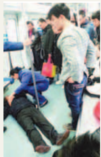
被踢到的老人躺在車廂內一動不動。網上圖片

香港文匯報訊 據荊楚網報道，武漢輕軌1號線上前日有兩名青年為搶座位，竟將一名老翁踢倒在地。目擊者稱，當日晚6時許輕軌駛至徐州新村站時，他發現一名年約70的老翁躺在地上，跟前座位上一個穿套頭運動衫的青年和另一個穿灰紅格子襯衣的青年起身下車。隨後得知，是那兩名青年和老翁搶座位時將老翁踢倒。