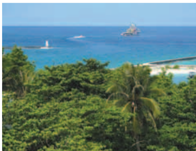
由永興島遠眺，風景怡人。

香港文匯報訊（記者 任一龍 北京報道）「愛我中華，為我疆土」——同聲地產《三沙賦》全球華人詩賦徵文大賽啟事暨座談會昨日在京舉行。詩賦徵文大賽以「謳歌海南悠久歷史文化，弘揚愛國主義精神」為主題，以「促進中華民族的偉大復興與祖國的統一繁榮」為目標，通過此次大賽，增進世界各地華人華裔文化的交流與合作，增強海內外華人華裔的凝聚力和愛國熱情。