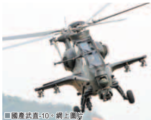
國產武直-10。

香港文匯報訊 綜合報道：中國官媒在有關解放軍風洞建設的報道中曝光了一款可能正在研製中的新型武裝直升機。有外媒揣測，與擅長對地攻擊的武直-10直升機不同，這款新型直升機的設計重點是空中作戰能力。他將填補解放軍陸航部隊空中格鬥型直升機的空白，從而強化其殺傷力。