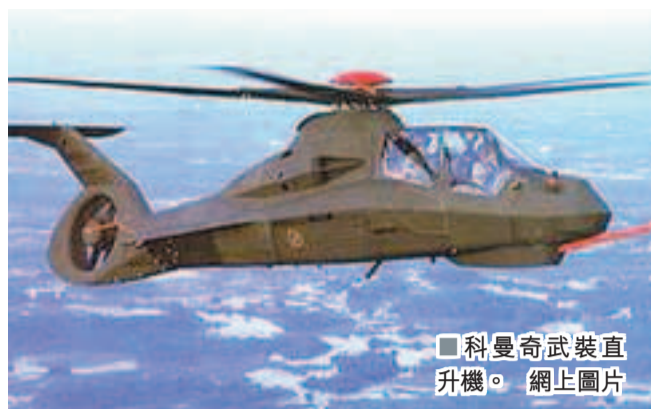
科曼奇武裝直升機。網上圖片