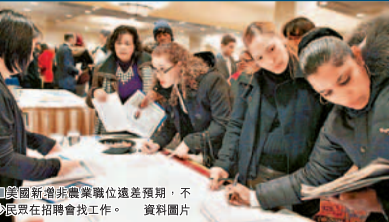
美國新增非農業職位遠差預期，不少民眾在招聘會找工作。 資料圖片

美國上月啟動自動削支機制，負面影響陸續浮現，不但新增非農業職位遠差預期，科研經費大減更威脅國家競爭力。有專家指，即使歐洲厲行緊縮，英德等國仍維持甚至增加研究開支，美國削支只會令科研人才白白流失至中國、印度、巴西等金磚國家，自食其果。 華盛頓智庫預計，科研削支會令美國國內生產總值(GDP)未來9年蒸發8,600億美元(約6.7萬億港元)。