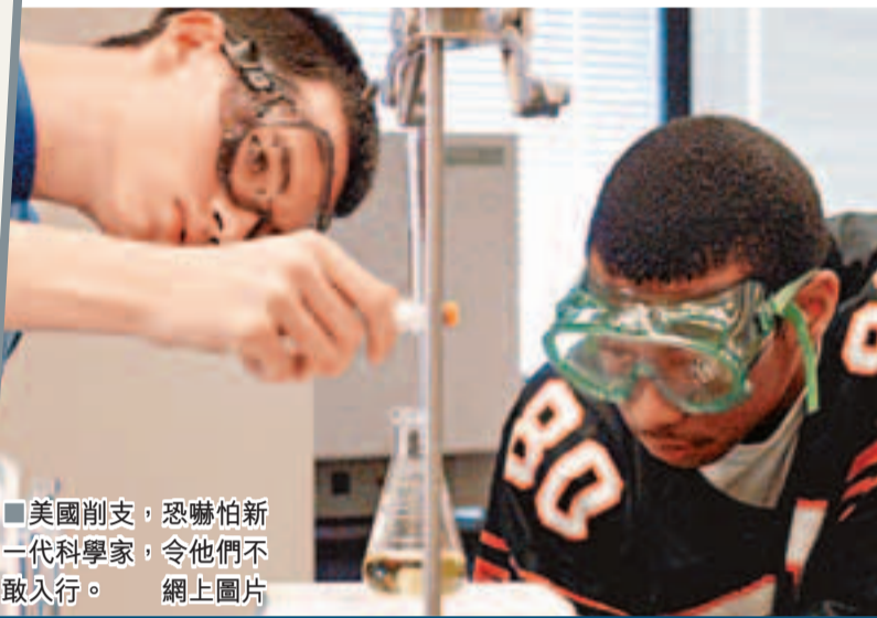
美國削支，恐嚇怕新一代科學家，令他們不敢入行。

美企醫療開支增 過肥員工加保費 有「士啤吐」要俾錢？面對醫療費用日益高漲，公司推出的自願性健康計劃效果差強人意，美國多間企業開始針對員工健康狀況作出懲罰，並要求他們提供身體質量指數、體重及血糖水平等資料，以及進行健康檢查，若不符合標準則須加大醫療保險費。部分企業如輪胎製造商米芝蓮北美公司(見圖)，已要求旗下患有高血壓或腰圍過粗的員工，明年多付逾1,000美元(約7,765港元)醫療保險費。 人力資源諮詢機構翰睿惠悅的研究顯示，美企本年對每位員工的平均醫療開支逾1.2萬美元(約9.3萬港元)，料此舉將成大趨勢。但有批評指，強制健康檢查將對員工構成重大壓力，他們擔心會因健康狀況遭解僱或不獲晉升。 ■《華爾街日報》