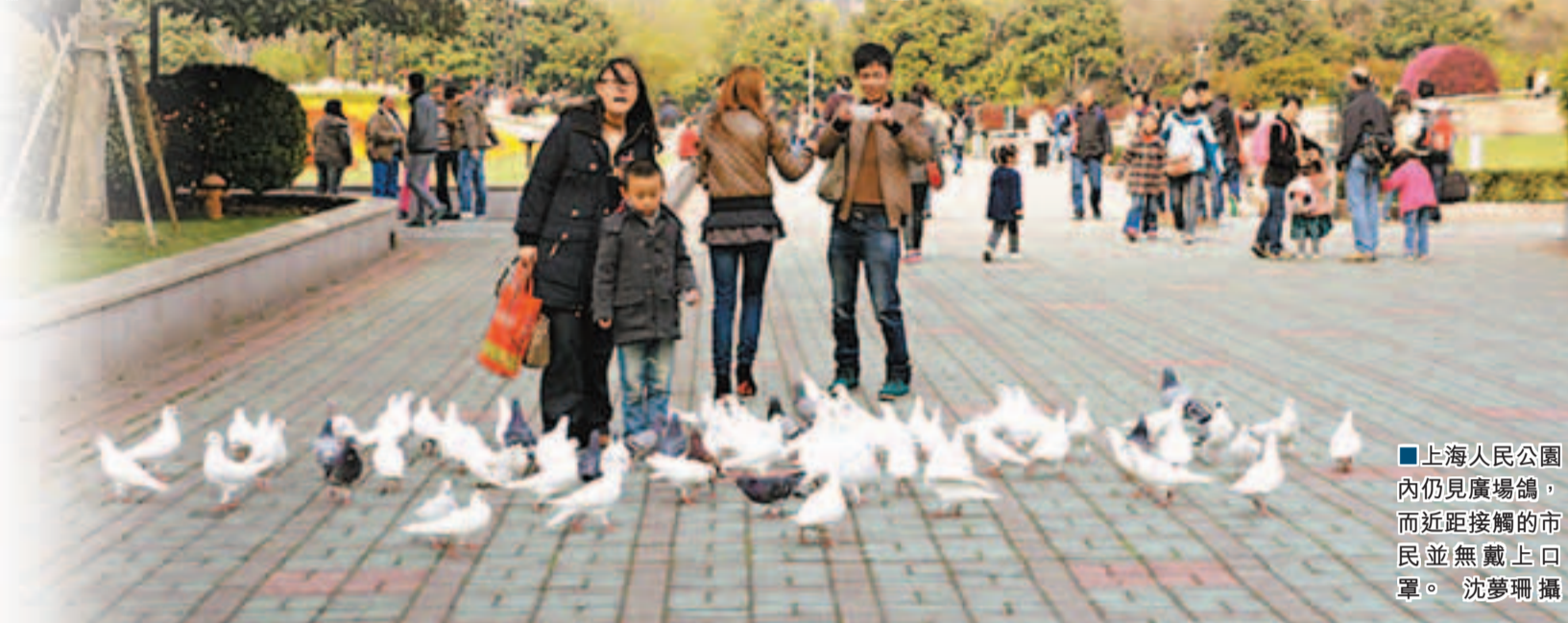
上海人民公園內仍見廣場鴿,而近距離接觸的市民並無戴上口罩。