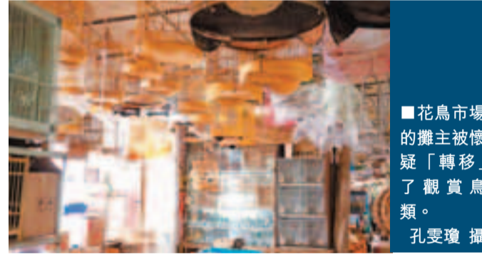
花鳥市場的攤主懷疑「轉移」了觀賞鳥類。

禁售活禽令下,上海花鳥市場的交易亦被禁止,記者昨日在楊浦區本溪路花鳥市場發現,雖然一眼望去看不到一隻鳥,但周圍群鳥噉食聲不絕於耳,疑被悄悄轉移至櫃枱下的箱子內。