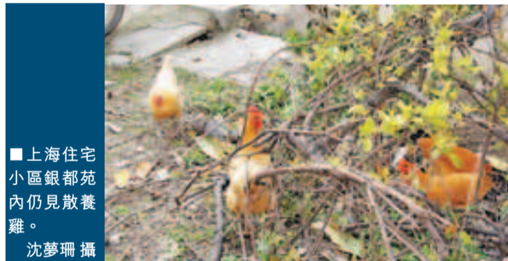
上海住宅小區銀都苑內仍見散養雞。

昨日,有網民在微博上發起行動,廣泛搜集上海市內有散養雞、鴨、鴿子現象的住宅小區,欲集中向有關部門舉報,消除禽流感隱患,網民合力製作的「黑名單」上包含了上海近30個住宅小區。