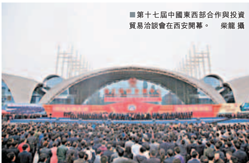
第十七屆中國東西合作與投資貿易洽談會在西安開幕。

據介紹,本屆西洽會會務一切從簡,開幕式現場沒有鮮花、紅地毯,不掛綵旗、氣球,只保留簡單的群眾鑼鼓表演,開幕式沒有領導剪綵,展館布展也沒有過度裝飾。同時簡化接待程序,不贈送紀念品,也不組織迎送活動。另據了解,今年大會的主要活動共安排了33項,活動總量也比去年的48項減少了30%以上,29項都是以項目對接為主的投資貿易促進活動有關,突出務實高效。