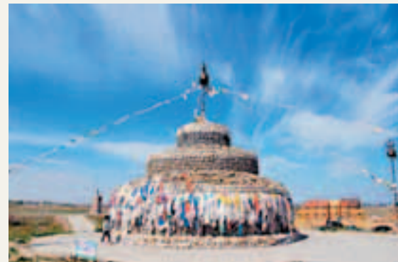
圖為北屯最著名的景點——成吉思汗西征駐包。

香港文匯報訊(記者 李小平 新疆報道)「美麗北屯魅力十師旅遊推介會」日前在烏魯木齊舉行,「共和國最年青的城市、成吉思汗西征出發地、兵團最北屯壘之地」北屯在推介會上精彩的亮相,引起了疆內外眾多知名旅行社和業界的高度關注。