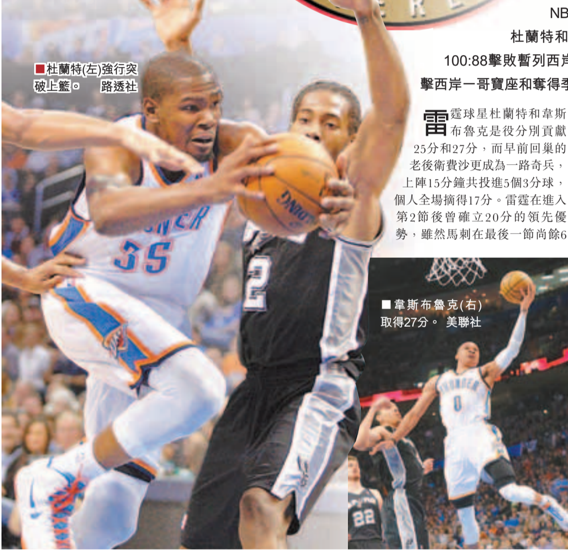
■杜蘭特(左)強行突破上籃。

NBA西岸榜首大戰周四爆發，雷霆憑藉「仔寶」杜蘭特和韋斯布魯克合共轟進52分，最終在主場以100:88擊敗暫列西岸首位的馬刺，總成績越追越近，有機會衝擊西岸一哥寶座和奪得季後賽主場優勢。