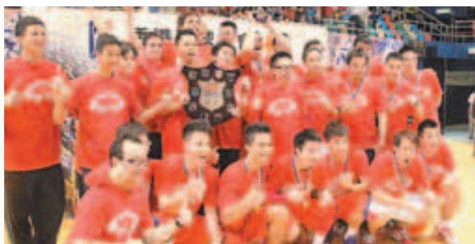
■南華成功衛冕。

香港文匯報訊(記者 黃舒慧)2013年銀牌籃球賽男子高級組決賽昨晚於伊利沙伯體育館落幕，南華在2700名球迷嘶嘶吶喊下，終以83:71憾贏永倫，成功衛冕冠軍。