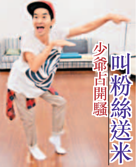
叫粉絲送米 少爺占開騷

香港文匯報訊 「少爺占朱豔強口口笑之Super me」Talk騷早前開賣門票反應熱烈,一連12場火速爆滿,開騷在即少爺占(見圖)已積極備戰。少爺占更邀得一班圈中好友如周柏豪、藍奕邦、梁烈唯、林一峰、羅力威等前來捧場。此外,少爺占希望各位蒞臨看騷的親朋戚友及粉絲不用送上花籃及果籃,改為送出一袋袋的白米,讓他完騷後可轉贈給有需要的機構,十分有意義。