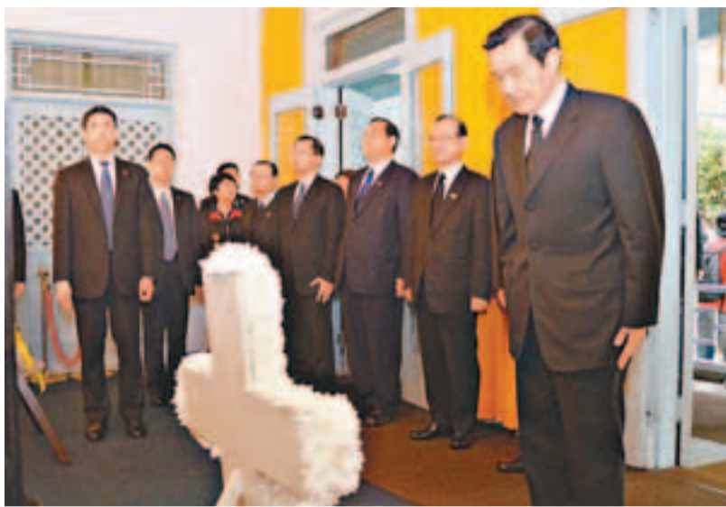
▲蔣介石逝世38周年祭日，馬英九率黨務主管前往慈湖謁陵。

文章指出，有關蔣介石的複雜歷史評價，至今仍是學者持續研究與爭論的對象，但蔣在白色恐怖時期對台灣社會的傷害也屬事實，認為政府不應在下一代面前對歷史人物「隱惡揚善」。