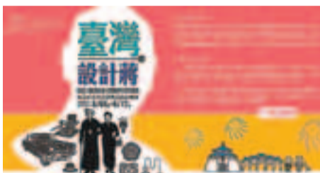
◀「台灣設計蔣」活動，以蔣介石與宋美齡的生活故事做宣傳，引發外界質疑。