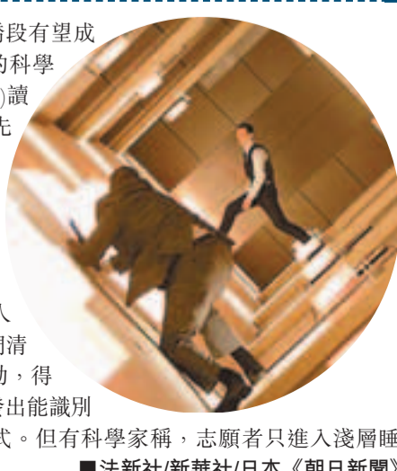
■法新社/新華社/日本《朝日新聞》