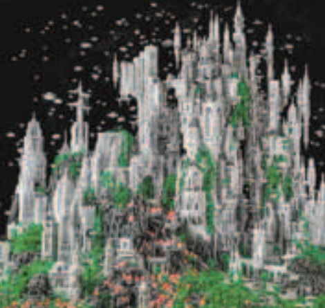
■美國紐約設計師多伊爾去年8月起每晚埋頭苦幹，花600小時完成5呎乘6呎的外星都市「第一類接觸」(Contact 1)，足足動用20萬塊樂高(Lego)積木。