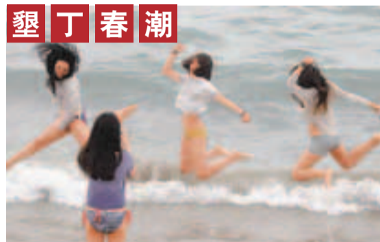
■墾丁音樂季5日熱鬧登場，南灣沙灘湧入人潮，年輕人在海邊拍照留念，洋溢青春氣息。 中央社

北市消防局119表示，下午3時16分接獲報案，救護車抵達時，傷者已無心跳。目前轄區台北市警察局士林分局會同故宮封鎖現場，並詢問旅行團導遊、同行觀光客，進一步釐清事故原因。同行團員到警局製作筆錄，有人向警方表示，張姓男子是刻意往下跳，疑似輕生，警方已經連絡男子家屬。