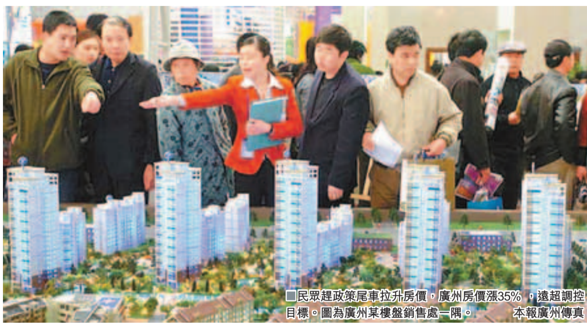
民眾趕政策尾車拉升房價，廣州房價漲35%，遠超調控目標。圖為廣州某樓盤銷售處一隅。本報廣州傳真

暨南大學管理學院教授胡剛說，現在廣州、北京等地前3個月的房價上漲幅度已經快超出全年上漲目標，如果政府不動真格，完成全年房價控制目標將十分艱巨。