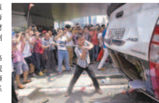
珠海民眾2012年9月在街上破壞日本轎車。

案發後，三人積極賠償了部分受損車輛的經濟損失，得到了受損車主的諒解。三人認罪並稱感後悔。