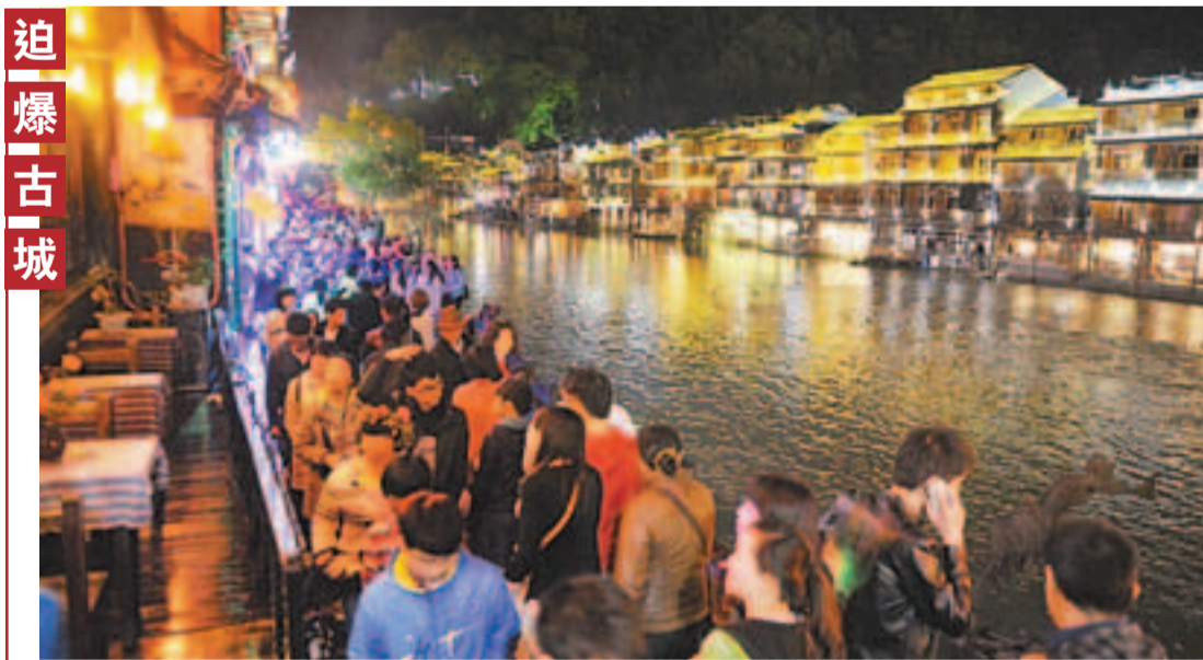
湖南鳳凰古城將於10日起收取148元門票費用。眾多遊客紛紛選擇清明假期前往遊玩。據鳳凰縣旅遊局統計，清明假期首日，鳳凰縣共接待遊客3.16萬人次，去年同比增長69.89%。圖為鳳凰古城內的街道5日晚被遊客「堵」得水洩不通。

這個地方辦法將充分保證被徵收房屋者的權益。採取暴力、威脅或者違反規定中斷供水、供熱、供氣、供電和道路通行等非法方式迫使被徵收人搬遷，造成損失的，將依法承擔賠償責任；對直接負責的主管人員和其他直接責任人員，構成犯罪的，依法追究刑事責任。