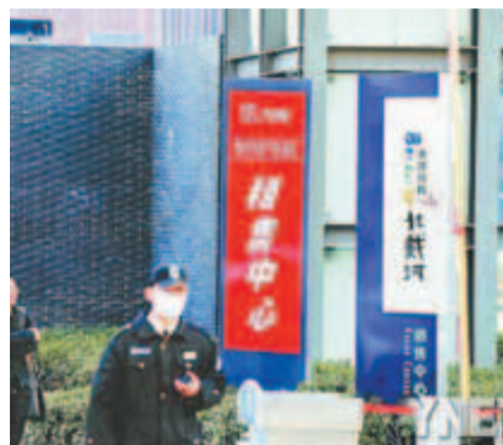
騙徒從萬科藍山租了11套房用於詐騙。

香港文匯報訊(記者 田一涵 北京報道)據北京一家媒體報道，20多名房屋購買人以每平方米低於市價近8,000元(人民幣，下同)的價格購得「便宜房」，事後發現所購實為「房主」租賃的房屋，他們交納的款項高達近億元。本案目前正在審理過程中。