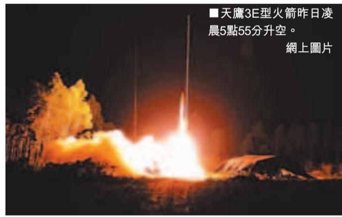
天鷹3E型火箭昨日凌晨5點55分升空。網上圖片

天鷹3E型火箭由中國航天科技集團公司所屬航天動力技術研究所研製，鯤鵬一號探空儀由中科院國家空間科學中心、中科院西安光機所和奧地利格拉茲大學共同研製，中科院國家空間科學中心是整個實驗的總體單位，同時負責火箭發射場、遙測、地面及科學應用系統任務。