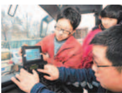
天津一工作人員在為長途客車安裝「北斗」導航終端。

香港文匯報訊 據中國之聲《央廣新聞》報道，交通運輸部日前要求江蘇、安徽、河北、陝西、山東、湖南、寧夏、貴州、天津等9個示範省(區)市的大客車、旅遊包車和危險品運輸車輛在3月底前80%以上安裝北斗導航終端。6月1日之前，凡未按照規定安裝北斗導航的車輛，以後就不予核發或審驗道路運輸證。