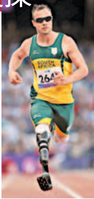
比斯托利的運動生涯進入「暫停」階段。他在出庭時聲稱當時將女友誤認為是入室竊賊，不過檢方認為他存在主觀上的故意，並以「預謀殺人罪」起訴他。