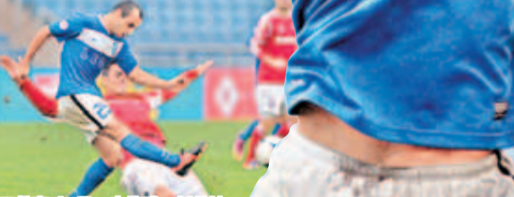
美高(左)早一步傳球。

61分鐘，南華中場狄卡奧借角球混戰於小禁區轉身抽射，可惜被對方守將於白界前擋出；10分鐘後，南華再次利用角球機會，可惜狄卡奧的頭槌攻門中樞彈出。隨着前鋒謝志強在補時階段於右禁區施射被救走，南華最終命喪小西灣，全失3分後，南華15戰得33分繼續榜首，以2分之微領先同樣戰畢15場的傑志。至於贏波的橫濱，以15戰得18分升上第6位，與同樣戰畢15場榜尾的日之泉JC晨曦有3分距離，護級壓力得以舒緩。