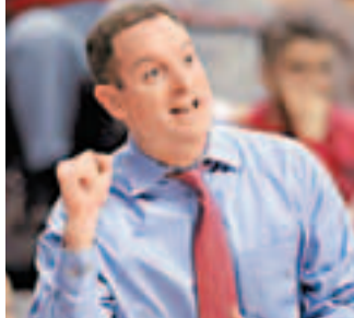
去找任何的藉口，我讓很多人失望，包括我的球員、我的管理層、羅格斯大學和球迷們。」曾經為羅格斯大學男籃工作過的前NBA球員默多克表示，因為萊斯的緣故，至少3名球員被迫轉學。新華社