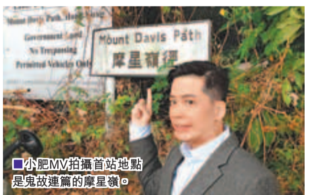
■小肥MV拍攝首站地點是鬼故連篇的摩星嶺。