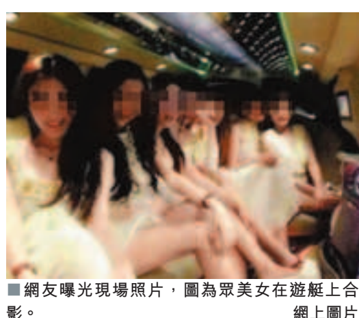
網友曝光現場照片,圖為眾美女在遊艇上合影。網上圖片

從3日下午開始,資陽市雁江區迎接鎮中心小學百餘學生陸續出現嘔吐、腹瀉、高燒等症狀,隨即被送往當地醫院進行救治。圖為正在醫院進行就診的學生。