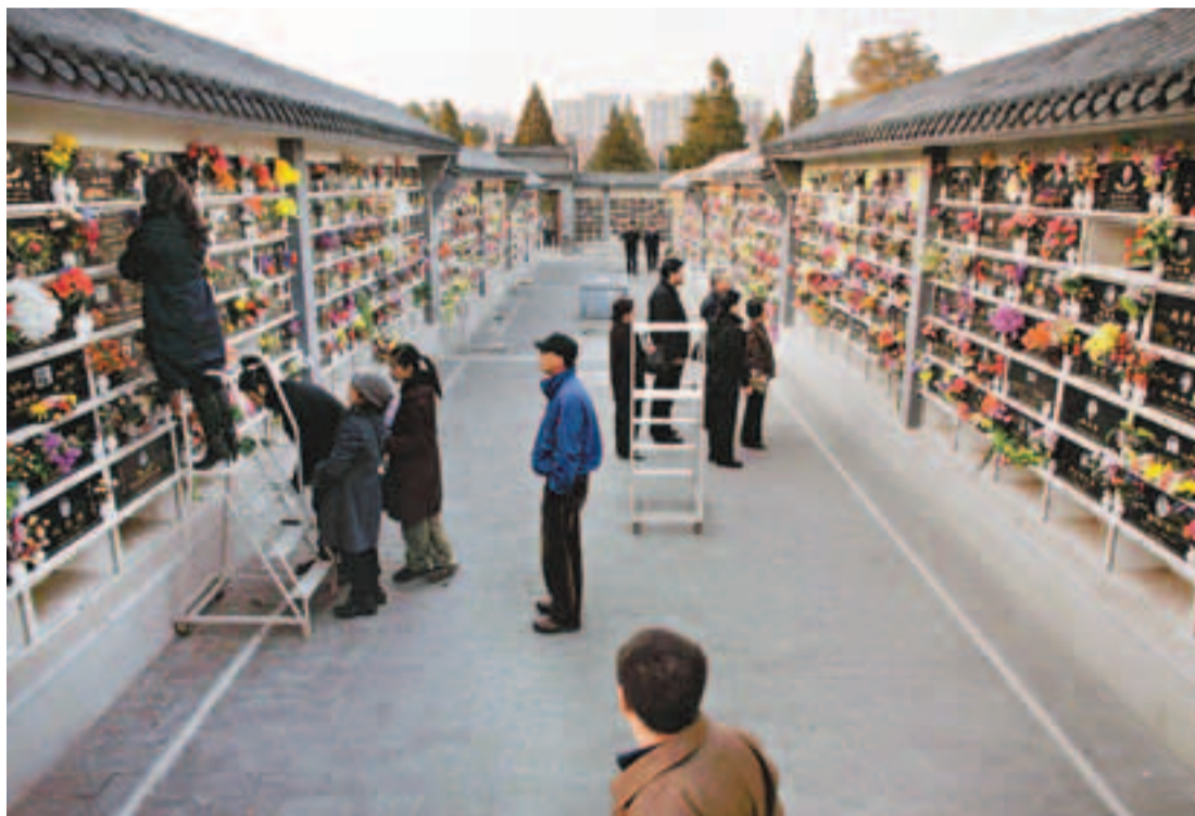
北京、上海、廣州等大型城市墓地緊缺,「炒墓」等非法現象頻生。圖為北京某墓園一隅。資料圖片

面對墓地短缺問題,官方殯葬改革的步伐也在加快。民政部部長李立國近日表示,惠民殯葬政策範圍將擴大到戶籍人口和常住人口,此外還將獎補生態安葬方式。分析人士認為,實行生態殯葬、綠色殯葬,可以達到少佔地、節約土地的目的。