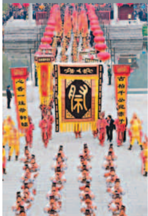
祭祀隊伍規模壯觀。

香港文匯報訊(記者 李陽波、胡素玉 黃陵報道)癸巳年(2013年)清明公祭軒轅黃帝典禮昨早在陝西省黃陵縣橋山黃帝陵祭壇廣場舉行,來自大陸、港澳及海外僑胞等1萬多名海內外中華兒女代表參加祭祀,共同緬懷中華民族的人文始祖——軒轅黃帝。參加者包括十一屆全國人大常委會副委員長華建敏、台灣海基會原董事長江丙坤、台灣新黨主席郁慕明、中共陝西