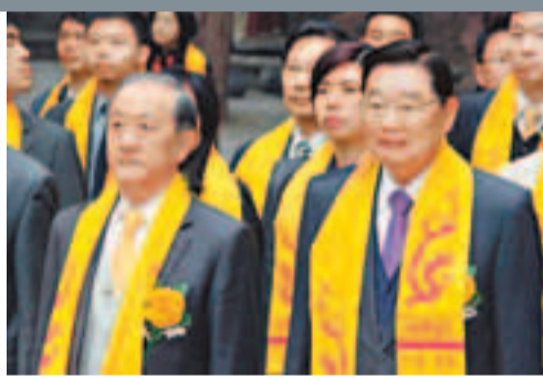
台灣海基會原董事長江丙坤(右)、台灣新黨主席郁慕明(左),出席祭拜儀式。中新社

公祭黃帝的傳統。上世紀80年代以來,清明公祭黃帝的典禮越來越受到海內外華人關注。如今,每年都有近百萬人次前來謁陵祭祖。