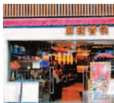
圖為巴蜀廚房麻辣香鍋餐飲店。

香港文匯報訊 據《深圳晚報》報道,為保障市民的食品安全,深圳市市場監管局近期對該市餐飲服務單位使用和銷售的酒店奶製品、麵製品、鹽焗食品、年糕、大米、食用油、廣式燒臘熟肉製品、煙熏肉製品進行抽檢,並於前日在其官方網站公佈了抽檢情況。其中,羅湖區巴蜀廚房麻辣香鍋餐飲店銷售的非即食煙熏臘肉、南山區新天府菜館銷售的煙熏臘肉均檢出無機砷超標,其中後者的煙熏臘肉無機砷超標20倍。資料顯示,無機砷俗稱「砒霜」,對人體危害非常大,國際癌症研究機構早在1980年就已將其確認為人類致癌物。