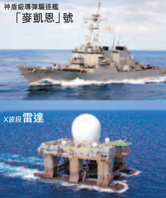
神盾級導彈驅逐艦「麥凱恩」號