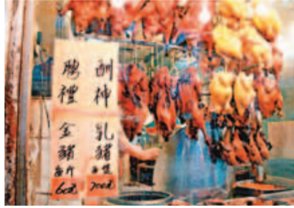
■繼去年乳豬價格急升近20%後,今年售價喘定。

香港文匯報訊(記者 聶曉輝、陳錦燕)每逢清明節,不少市民帶備乳豬、燒雞拜祭先人。繼去年乳豬價格急升近20%後,今年價格喘定,甚至呈現跌勢。有燒臘店東主稱,今年市道一般,故乳豬入貨價較去年下跌約10%,期望以「薄利多銷」形式出售。臨近清明節,生意十分理想,每日可出售乳豬40隻至50隻;清明節當日預訂數目更多達60隻。