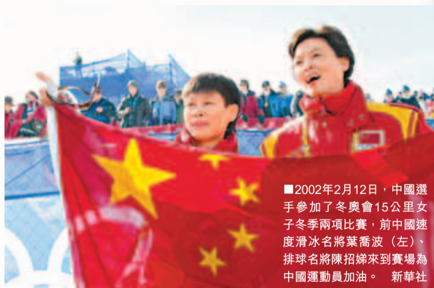
■2002年2月12日，中國選手參加了冬奧會15公里女子冬季兩項比賽，前中國速度滑冰名將葉喬波（左）、排球名將陳招娣來到賽場為中國運動員加油。