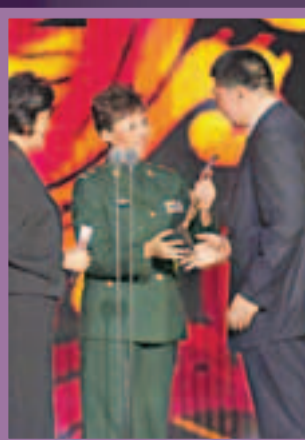
■2012年1月15日，陳招娣（中）和國家體育總局網球運動管理中心主任、前女排隊員孫晉芳（左）在2011 CCTV 體壇風雲人物頒獎盛典上向中國女排主教練俞覺敏頒發年度最佳團隊獎。