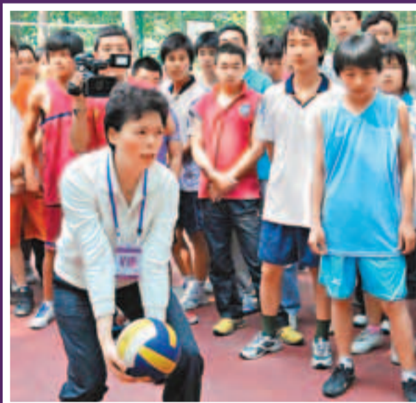
■2010年5月29日，陳招娣為學生們講解接發球的動作要領。當日，曾創造「五連冠」輝煌成績的老國家女排隊員來到漯河市體校，觀摩了當地中學生排球隊的訓練和比賽，並現場進行了技術指導。 新華社