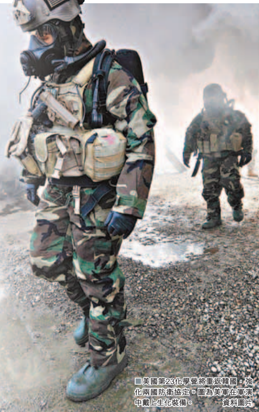
美國第23化學營將重返韓國，強化兩國防衛協定。圖為美軍在軍演中戴上生化裝備。資料圖片