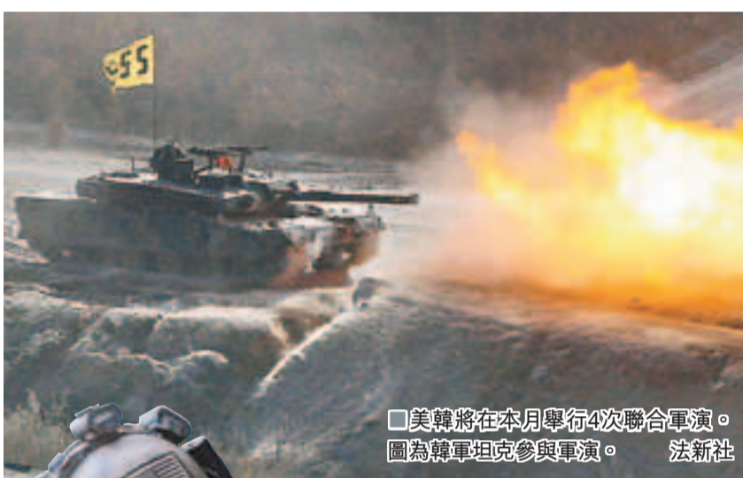
美韓將在本月舉行4次聯合軍演。圖為韓軍坦克參與軍演。