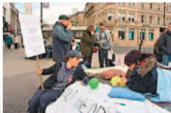
有人上街抗議。電視圖片