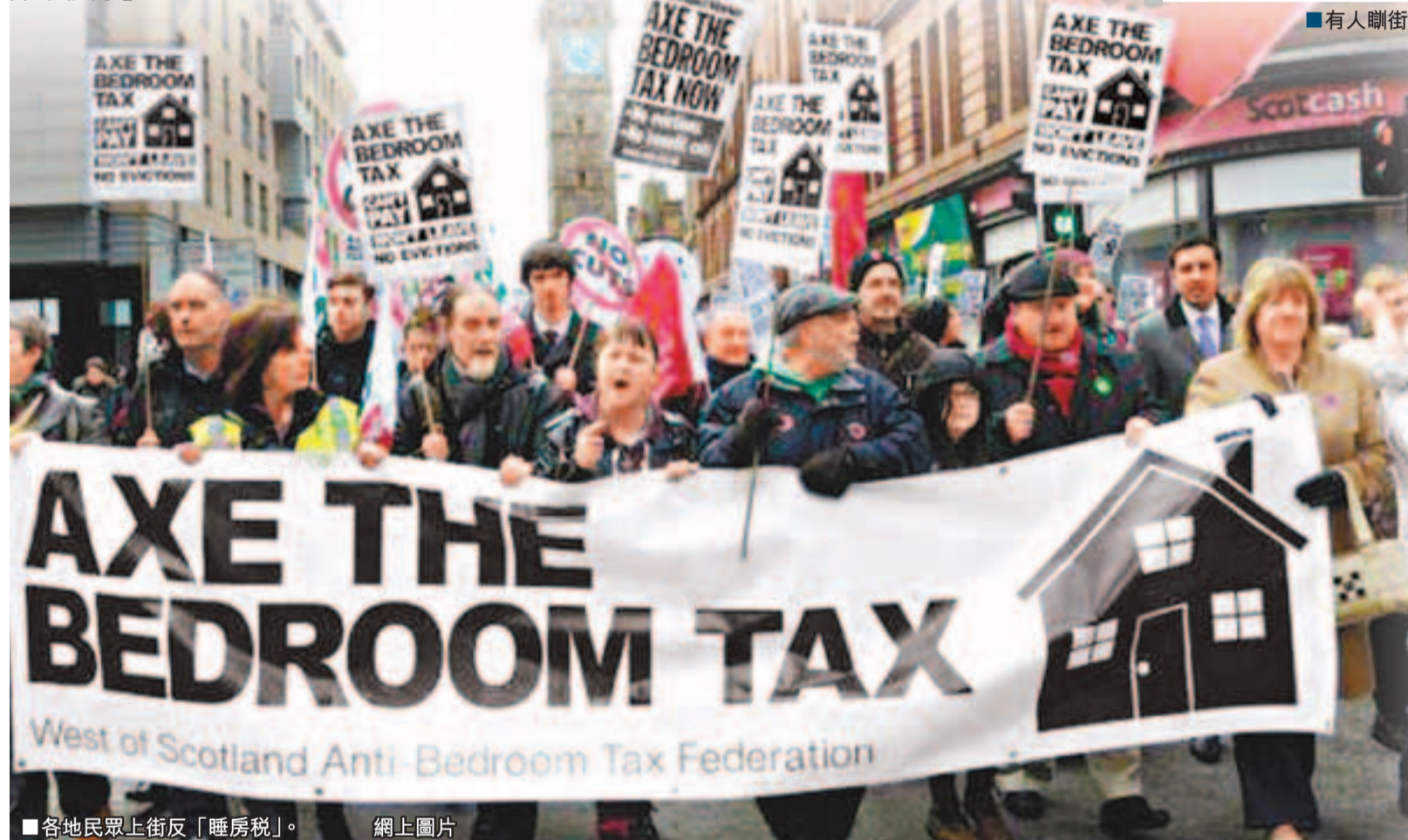
各地民眾上街反「睡房稅」。網上圖片