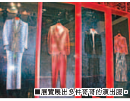
展覽展出多件哥哥的演出服。