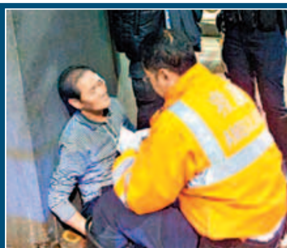
救護員即場為受傷途人檢查傷勢。