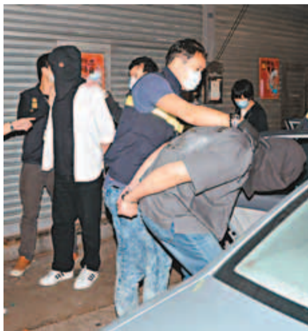
2名涉嫌藏毒的男子被蒙頭帶走。