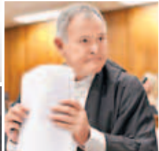
律師羅斯指比斯托利斯不會潛逃。