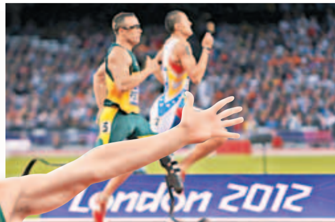
比斯托利斯(左)對上一次參賽已是去年的倫敦殘奧。資料圖片

在「情人節」當天凌晨，比斯托利涉嫌在比勒陀利亞的家中用手槍打死女友斯廷坎普。儘管「刀鋒戰士」稱自己意外射殺女友，不過檢方認為他存在主觀上的故意，並以「預謀殺人罪」起訴他。一旦罪名成立，比斯托利最高可被判處終身監禁。 ■新華社