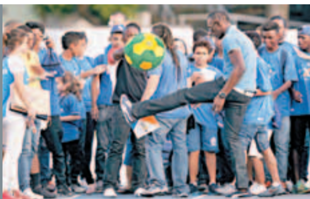
保特一展控球技術。

連奪兩屆奧運會男子100米和200米跑金牌的牙買加飛人保特，現正身處巴西，準備周日在里約熱內盧名勝科帕卡巴納海灘挑戰150米跑，這名喜愛夜蒲的飛人對巴西認識最深的並非其熱愛的足球，而是沙灘和穿上性感泳衣的美女，他更直認希望有時間到巴西的夜場朝聖。