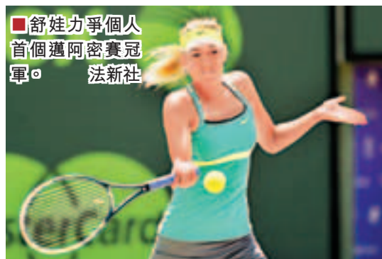
舒娃力爭個人首個邁阿密賽冠軍。

在周四進行的邁阿密網球賽女單準決賽中，3號種子舒拉寶娃和頭號種子沙連娜威廉絲(細威)均順利擊敗各自對手，會師決賽。舒娃此前在該項賽事中4次與冠軍失之交臂，4強賽以6:2、6:1擊敗塞爾維亞球手贊高域後，向個人首個邁阿密賽女單