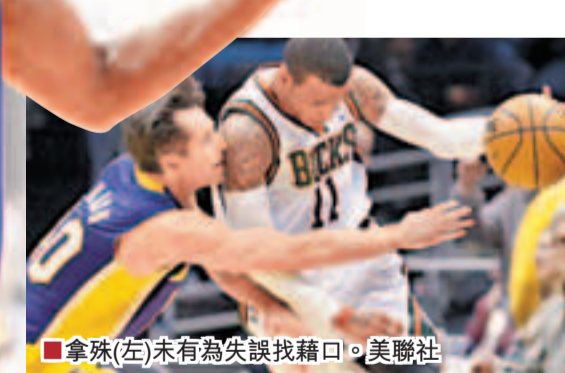
拿殊(左)未有為失誤找藉口。

失誤似乎已成湖人頑疾，在27日對木狼時失誤有21次，22日負巫師時有17次失誤。雖然迪安東尼一直強調要加強防守，但湖人防守並沒有多少起色。今仗湖人又打了一場高開低走的比