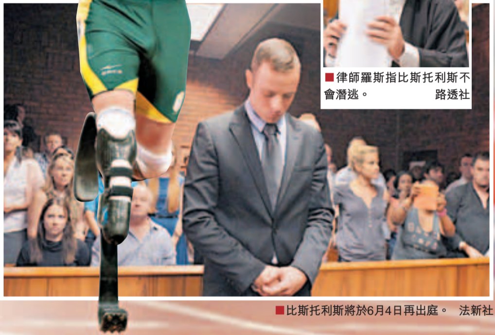
比斯托利斯將於6月4日再出庭。