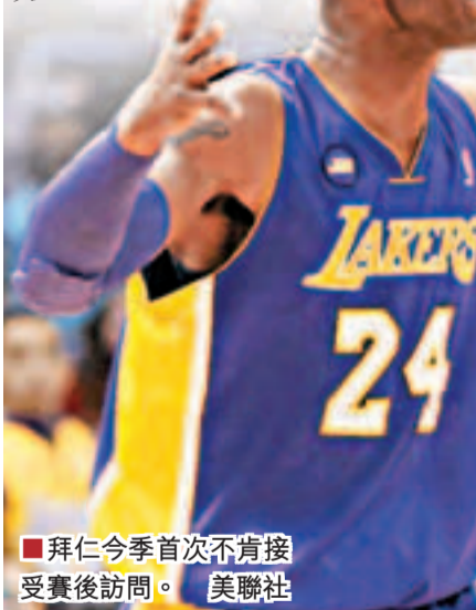
拜仁今季首次不肯接受賽後訪問。

湖人未能打破本季連續比賽第2場必敗的魔咒，周四作客以103:113不敵公鹿，再次陷入危機邊緣，目前僅領先西岸第9名的爵士半個勝場。高比拜仁今仗奪得30分，但出現6次失誤，湖人公關賽後表示拜仁不會接受採訪，這在本賽季尚屬首次。