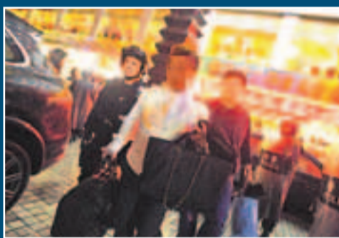
被特警帶走的港黑幫成員。