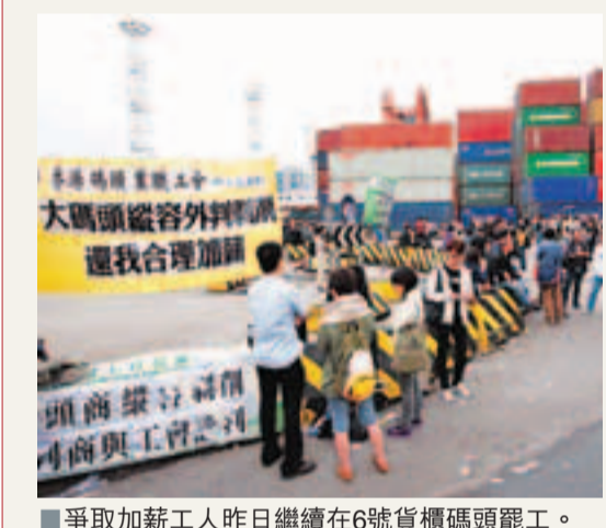
爭取加薪工人昨日繼續在6號貨櫃碼頭罷工。