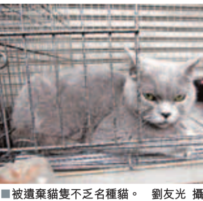
被遺棄貓隻不乏名種貓。

業主昨晨9時許收樓時發現有11隻貓被遺棄割房內，疑被人虐待於是報警。警員到場檢視後，發現11隻貓健康良好，單位內有食物及水。期間謝婦聞訊趕返，經商討後警員通知漁護處職員到場將貓隻檢走，謝婦目送愛貓離開時顯得依依不捨，希望有心人會領養牠們，並說有能力時會全數將貓隻領回。