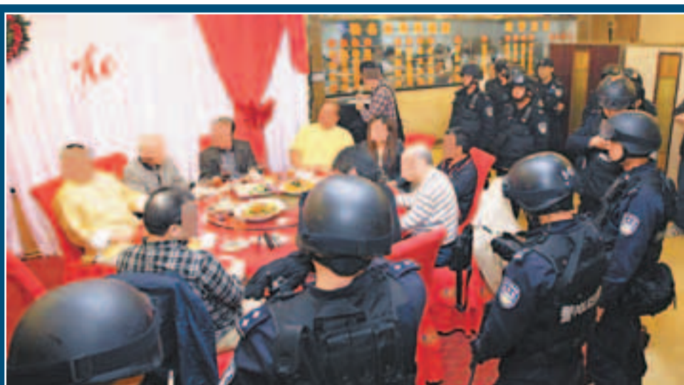
反黑特警包圍主家席，當中不乏「大佬輩」。