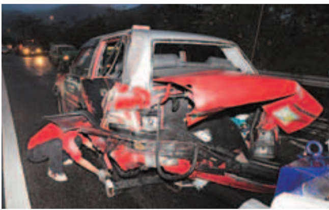
被撞市區的士車尾盡毀。

香港文匯報訊(記者 杜法祖)天雨路滑，北大嶼山公路昨凌晨發生4輛的士串燒車禍！4輛的士雨中沿北大嶼山公路行駛，途中由於前行一輛的士突然減速，尾隨而來另外3輛的士收掣不及，結果釀成4車連環碰撞，4名的士司機和3名男女乘客同告受傷。警方正調查意外原因，不排除有人打瞌睡肇禍。