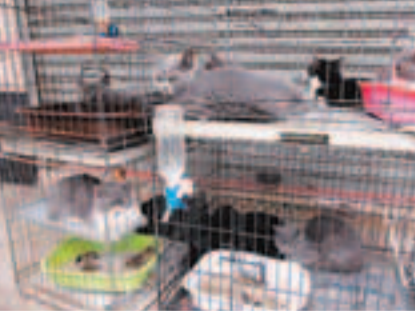
橡樹街被遺棄在割房的11隻貓。