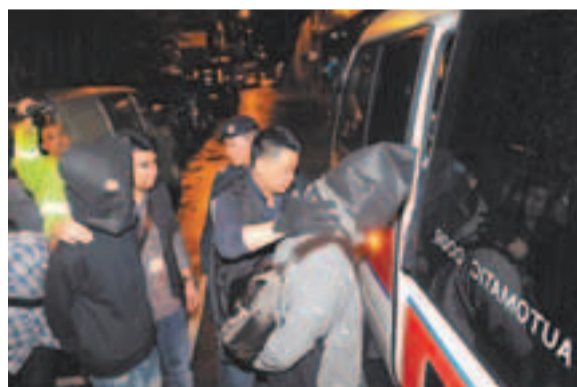
重案組代號「領先」反黑行動在葵涌拘捕的黑人物。

吧和一間夜總會，在夜總會內拘捕1男2女，檢獲少量可卡因，該2名女子是夜總會領班，有人涉嫌向顧客兜售毒品。警方亦在場內檢獲2萬元現金，相信是她們販毒所得收益。