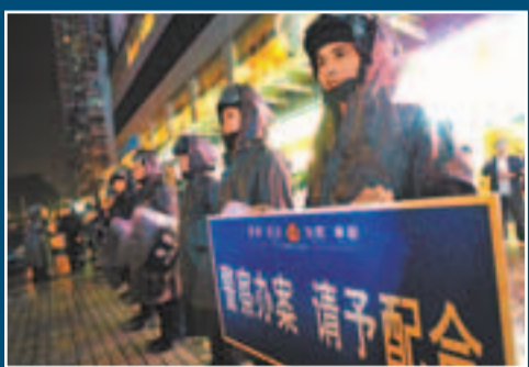
特警包圍酒樓並驅趕人群。

香港文匯報訊(記者 李薇 深圳報道)深圳公安前晚(28日)出動350名荷槍實彈特警，在深圳福田口岸一帶展開大規模反黑行動，其間帶走160名疑正進行幫會儀式的香港黑社會集團成員，當中包括14名不同幫派的黑幫叔父輩大佬，公安懷疑當時有部分幫會話事人正商討選舉坐館事宜。據悉，當時香港武打明星陳惠敏亦在座，全部人被福田公安刑偵大隊通宵問話，直至昨日下午2時方獲釋放。