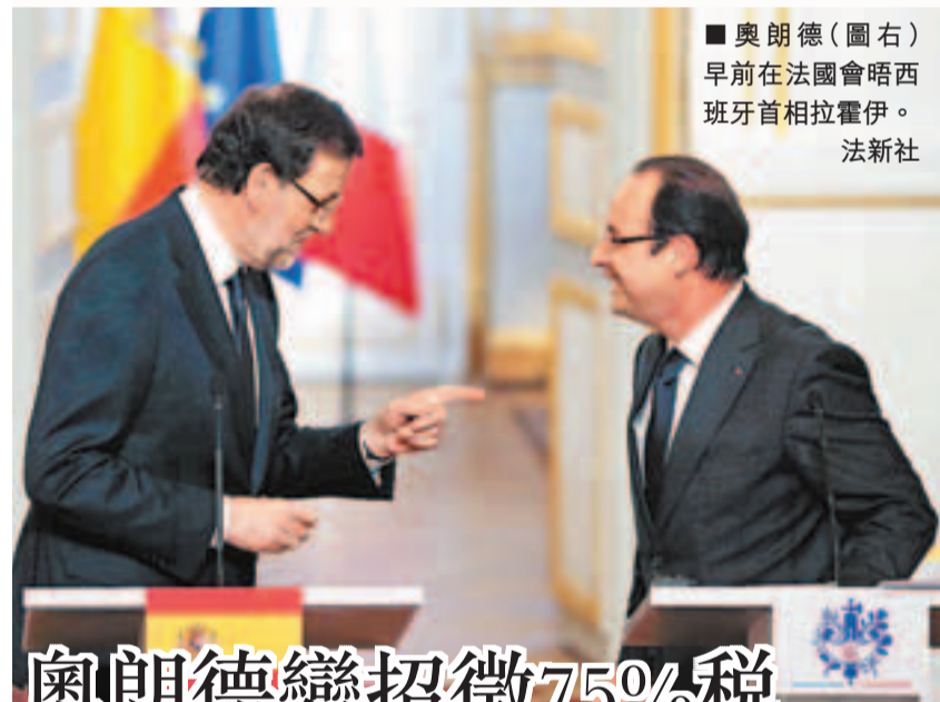
■奧朗德(圖右)早前在法國會晤西班牙首相拉霍伊。