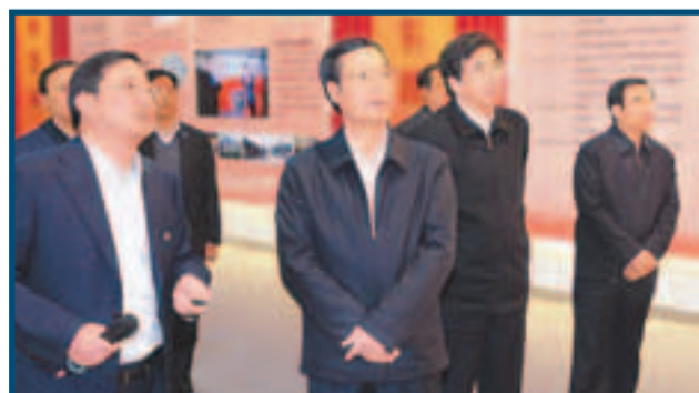
國務院副總理張高麗（右三）前日下午到中关村國家自主創新示範區調研。右二為北京市委書記郭金龍。

香港文匯報訊 國務院副總理張高麗前日下午在北京市委書記郭金龍等陪同下，到北京中关村國家自主創新示範區調研，了解科興、百度、聯想、曙光等企業生產經營情況，與企業家、科技人員交流。張高麗昨日上午又在京召開企業家座談會，同十多家企業負責人一起分析經濟走勢，力促提高經濟增長的品質和效益。