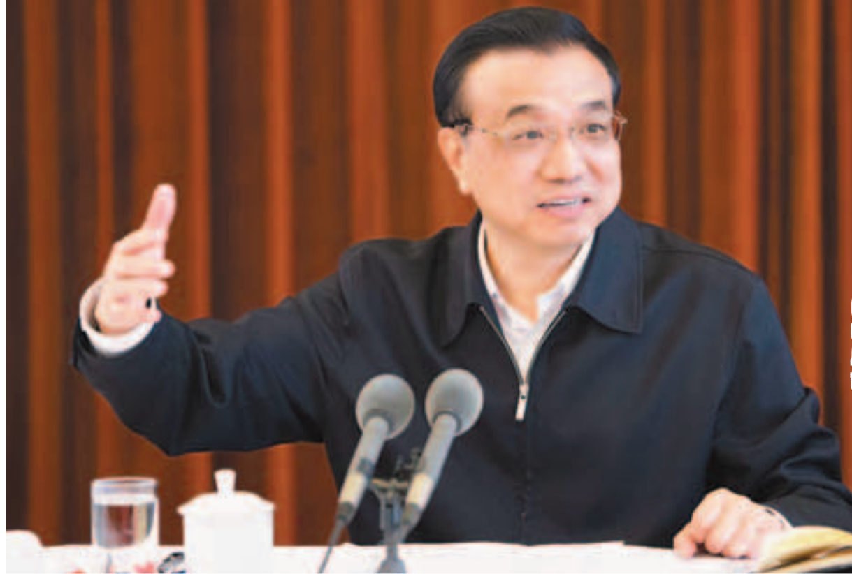
國務院總理李克強昨日在上海經濟形勢座談會上與大家深入討論。

香港文匯報訊（記者 劉坤領 北京報道）國務院總理李克強昨日在上海召開部分省市經濟形勢座談會上提出，要用開放促進改革，用開放擴大內需，用開放形成倒逼機制，以勇氣和智慧，打造中國經濟升級版。他表示，長三角經濟份量重大，調研反映出經濟形勢總體平穩，但當前國內外經濟環境仍然錯綜複雜，積極因素和隱憂並存，要統籌考慮「穩增長、防通脹、控風險」，以「穩中求進」作為經濟宏觀政策的總基調。