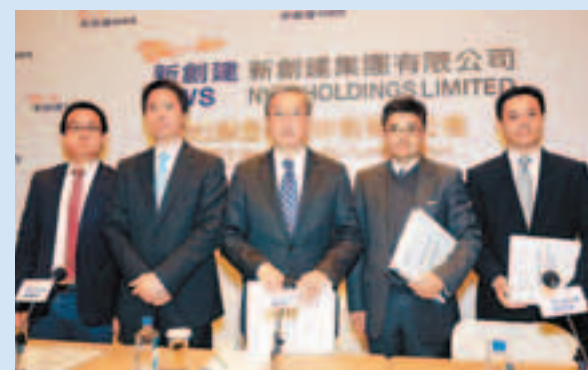
■新創建早前公佈中期業績，實際純利年增33%。

董事會議決派發截至2013年6月30日止年度的中期股息每股0.29港元，是次派息比率約為50.2%。