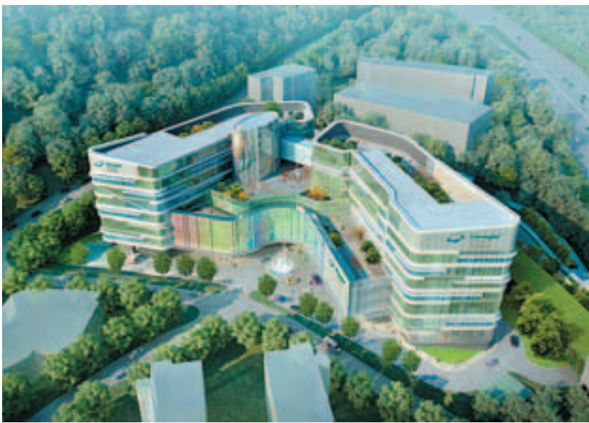
■港怡醫院規劃設計效果圖

據悉，港怡醫院的項目總投資額約50億元，由百匯班台與新創建集團分別承擔60%及40%。香港大學李嘉誠醫學院將會作為醫院的臨床合作夥伴，負責港怡醫院的臨床管理、專業水準監督、人才招聘及醫護人員(包括醫生、護士及其他醫護人員)的培訓。「我們在本地擁有豐富的設施管理及建設經驗，特別是旗下的協興建築曾多次參與興建醫院項目，我們相信憑藉這些經驗，可對港怡醫院項目在建築、發展及營運方面，帶來很大的幫助。」