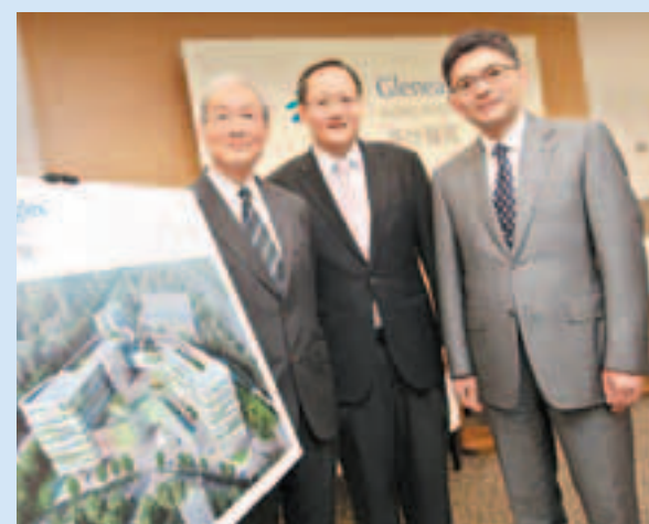
■由新創建集團和新加坡百匯班台合資、港大李嘉誠醫學院為合作夥伴的GHK Hospital Limited，獲批於黃竹坑興建私家醫院，預計最快可於2016年底投入服務。

該醫院由三個機構共同合作籌辦，包括百匯班台有限公司(百匯班台)、新創建集團有限公司(新創建集團)及香港大學李嘉誠醫學院(港大)。醫院的三個合作夥伴，將會憑藉其信念及過去所累積的豐富經驗，為醫院引進先進的臨床設備及聘請達國際級水準的專業醫護人才，為香港市民服務。