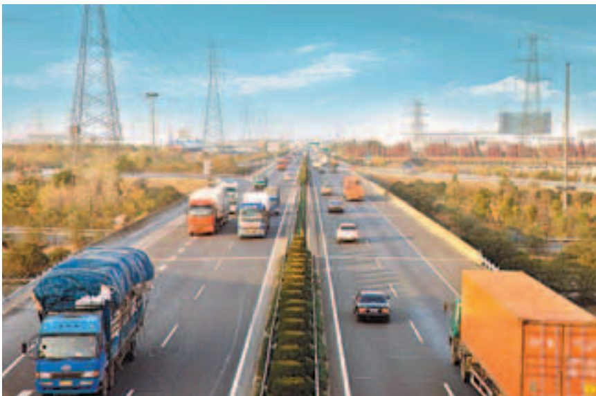
■內地基建依然將會是新創建未來重點投資方向。圖為杭州繞城高速公路。

他並稱，未來新創建集團將積極利用香港服務業和零售相關業務的蓬勃發展為集團創造收入。與此同時，集團將繼續發揮其雄厚的財政實力，於香港、內地及歐洲物色合適的投資機會以帶來穩定的經常性收入來源，為股東創造長遠價值。「在發展業務的同時，我們會一如既往地重視企業社會責任，繼續聯繫社會、贊助慈善活動，企業義工隊『新創建愛心聯盟』會更積極服務社會。」