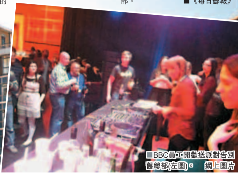
BBC員工開歡送派對告別舊總部(左圖)