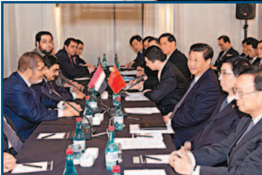
習近平在南非德班與埃及總統穆爾西會談。

中印爭議領土逾12萬平方公里。中印邊界問題，主要包括東段、錫金段、中段和西段。中國與印度兩國邊界全長約1,700公里，分西、中、東三段。西段約600公里，中段約450公里，東段約650公里。東段爭議領土9萬平方公里，位於西藏，目前被印度佔領；中段爭議領土2,000平方公里，約等於1個深圳，也位於西藏，同樣由印度佔領；西段爭議領土3.3萬平方公里，即新疆的阿克賽欽地區，目前由中國控制。目前，雙方有爭議的地區約12.5萬平方公里，主要位於東段藏南地區的「麥克馬洪線」附近。1962年兩國因邊境爭端爆發了一場邊境戰爭。幾十年來，雖然中印政府一直在尋找公平、合理解決邊境爭端的方式方法，但進展緩慢。