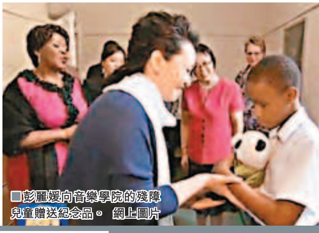
彭麗媛向音樂學院的殘障兒童贈送紀念品。

香港文匯報訊 據中新社消息：當地時間27日下午，習近平主席夫人彭麗媛在南非總統祖馬夫人恩蓋馬陪同下，來到德班音樂學校參觀。彭麗媛參觀了鋼琴教室和豎笛教室，欣賞了師生們和當地青年管樂隊表演的古典音樂和具有濃郁民族風格的祖魯族歌曲，並就音樂教育問題同師生們交流。這所學校旨在向殘疾人等教授音樂技能，幫助他們融入社會，現有在校學生400名。