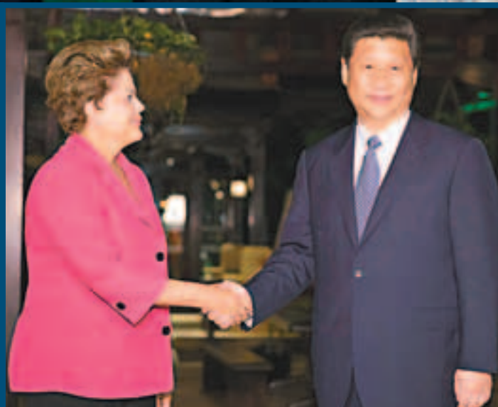
習近平會見巴西總統羅塞夫。