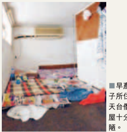
早產女子所住的天台簡陋屋十分簡陋。

香港文匯報訊(記者 杜法祖)疑有不良嗜好女子，因男女銀鑄入獄加上本身無業，近月雖已懷孕7月腹大便秘，仍獨居蠅居深水埗一間簡陋天台屋。昨晨女子突在家中胎動，街坊聽聞有人呼救後代為報警，但等不及救護車到來女子便在家中誕下早產女嬰，惟女嬰送院終證實夭折。警方調查後相信事件無可疑，暫列「發現屍體」案處理，稍後將驗屍確定女嬰死因。