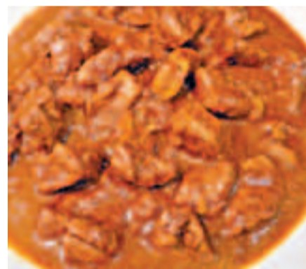
咖喱味道濃烈，商店造假難以發現。

咖喱羊肉由於醬料味道濃烈，容易遮掩肉類味道，被認為是偽冒食品的重災區。英國去年在西米德蘭茲郡調查了20款咖喱羊肉，發現全混有平價牛肉、豬肉和雞肉，當中4款更完全不含羊肉，令人訝異。