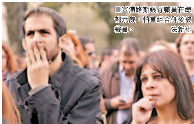
塞浦路斯銀行職員在總部示威，怕重組合併後被裁員。