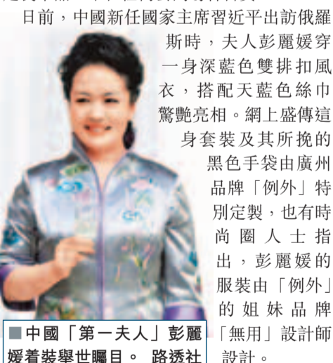
中國「第一夫人」彭麗媛裝舉世矚目。

香港文匯報訊 據中新社消息：因中國「第一夫人」彭麗媛而備受矚目的時尚品牌「例外」27日發佈聲明稱，彭麗媛是其老客戶，此次出訪部分服裝為中國著名設計師馬可專門設計定製，而此次設計及製作為專項定製單品，不在任何公開場合售賣。