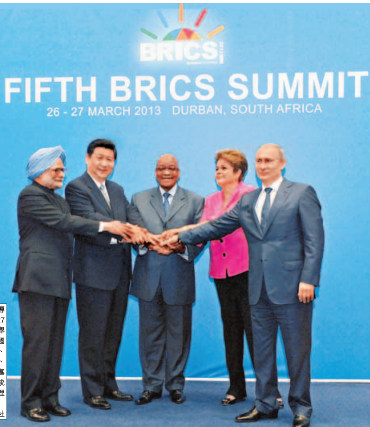
金磚國家領導人第五次會晤27日在南非德班舉行。圖為中國國家主席習近平、南非總統祖馬、巴西總統羅塞芙、俄羅斯總統普京、印度總理辛格合影。