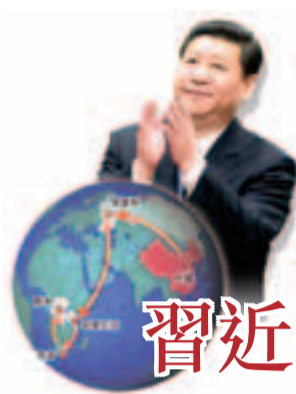
習近平外訪 快轉變經濟發展方式，主動尋找新的經濟增長點。

香港文匯報訊 據中新社報道，金磚國家領導人第五次會晤27日在南非德班舉行。中國國家主席習近平發表了題為《攜手合作，共同發展》的主旨講話，強調加強金磚國家合作，是我們共同的願望和責任。習近平特別指出，當前形勢下最重要的是共同應對好世界經濟下行的風險，同時加快轉變經濟發展方式，主動尋找新的經濟增長點。