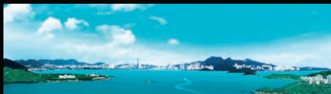
愉景灣擁有多層次遼闊景致，遠眺中環至南區環迴海景*

愉景灣為亞洲區極具前瞻性的「環保城」，以0.15倍的極低密度地積比率，融合南歐島岸生活與多達30多個不同國家的國際文化，再配合全新二白灣綜合發展，當中包括歐陸式購物商場、海景商業樓面、豪華度假及會議酒店與浪漫婚禮教堂等，令這豪宅區成為獨有的綜合發展項目；再加上完善的交通網絡，及未來之港珠澳大橋及擬建之港深西部快速軌道，中港兩地同步連繫，掌握都會脈搏，盡顯中港連軸之地利優勢，物業的深厚升值潛力不言而喻。