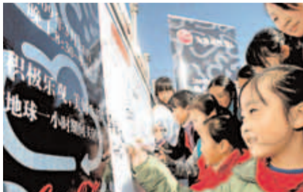
■內地從小培養民眾的環保意識。圖為小學生簽名支持「地球熄燈1小時」活動。 資料圖片

1999年後，隨着中國經濟的持續高速發展，環境問題逐步凸顯出來，環境外交也進入政策調整期。為擺脫被動應