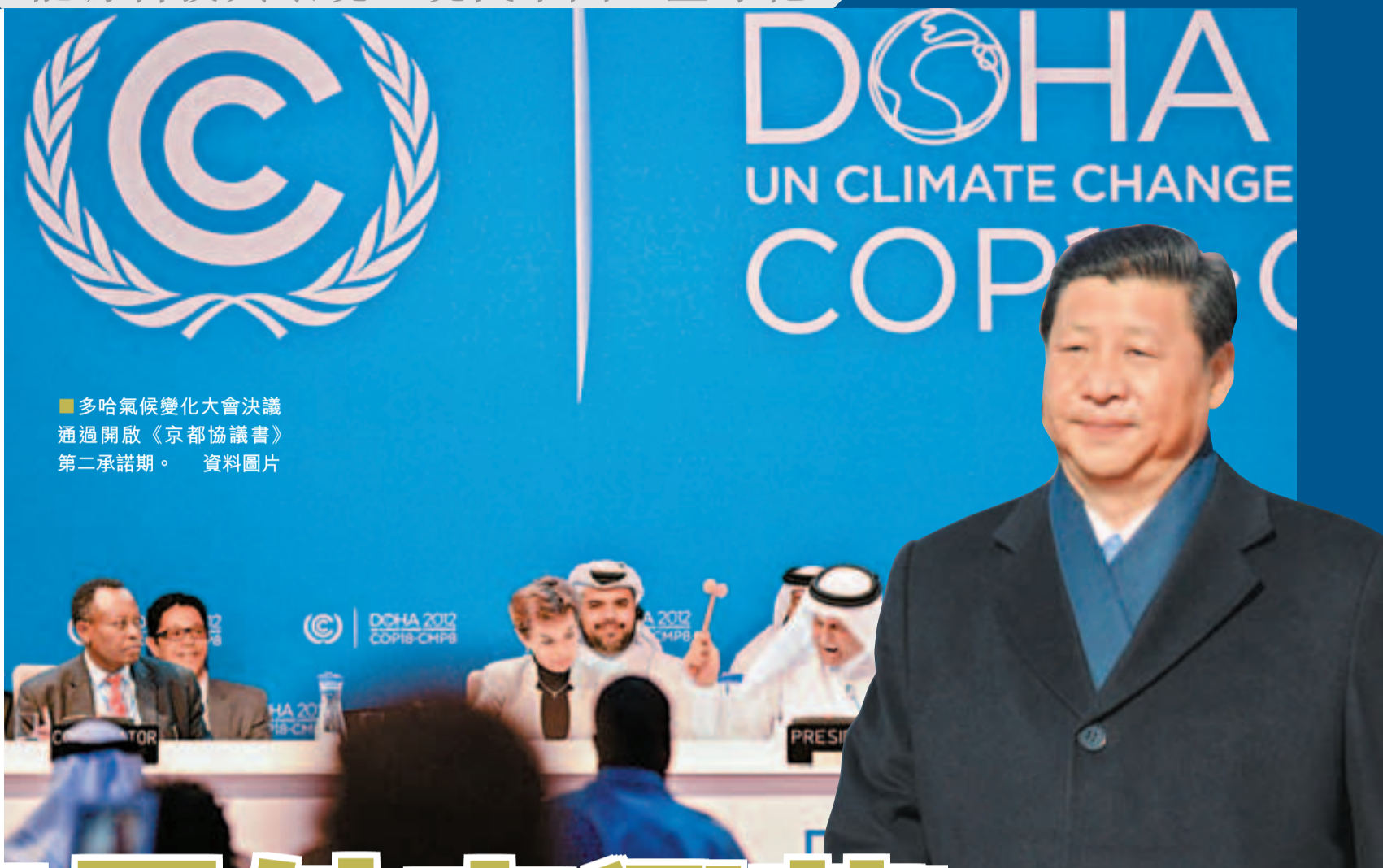
■多哈氣候變化大會決議通過開啟《京都協議書》第二承諾期。 資料圖片

華東師範大學政治學系歷經60餘年的淬礪，為國家培養大批學界、政界與商界精英，並確立在全國政治學學科中的領先地位。香港《文匯報》與華東師範大學政治學系合作推出通識專欄，從多角度探究中國各方面的外交政策的發展演變與國際關係的風雲變幻，為本港通識科高中生提供最實用的「現代中國」單元學習材料。