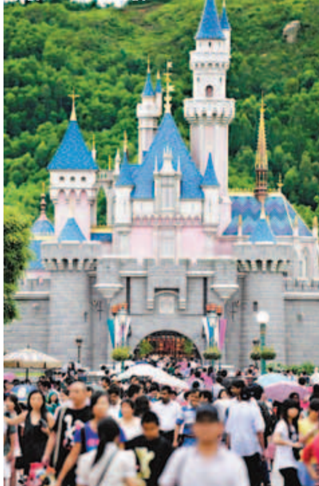
香港迪士尼樂園明日起加價。資料圖片

香港文匯報訊(記者 姚寶)開業7年,去年首度錄得盈餘的香港迪士尼樂園宣布加價,明日起成人門票由399元加至450元,加幅近13%;小童門票由285元增至320元,加幅為12%,本港居民在6月底前,仍可以現價購買一日標準及小童門票。部分全年通行證亦調整票價,成年人金卡加幅達14.5%,不過,一向最受香港市民歡迎及價錢最平的紅卡卻會取消,持卡人可繼續使用直至會籍到期,若要繼續購買年票,就要多付200元「升級」買銀卡,變相加價31%,被指是向港人「開刀」。園方發言人拒絕透露紅卡的使用數量,只強調銀卡提供的優惠較紅卡多,即使取消紅卡,市民仍然會感到「划算」。本港另一個主題公園海洋公園就表示,暫時未有計劃加價,但會定期檢討票價水平。