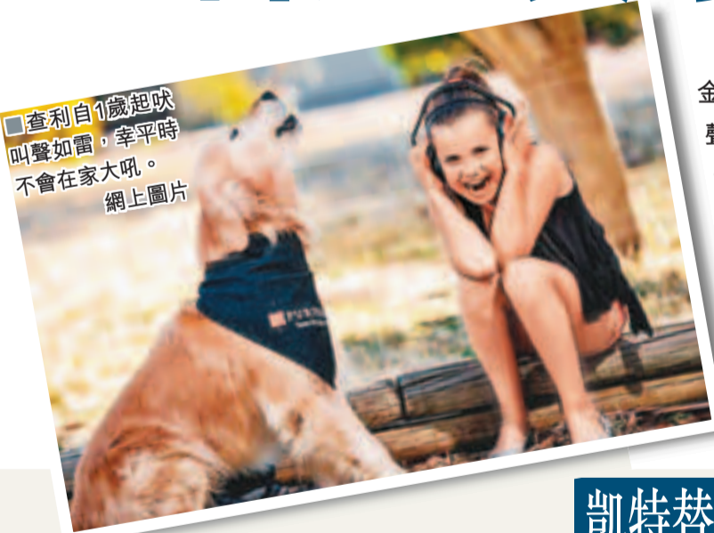
■查利自1歲起吠叫聲如雷，幸平時不會在家大吼。

狗狗也懂獅吼功？澳洲6歲金毛尋回犬「查利」的吠叫聲震耳欲聾，音量高達113.1分貝，比噴射機及電鑽的噪音更吵，亦超於人類最高可接受的110分貝，打破由德國牧羊犬2009年創下的108分貝健力士世界紀錄。