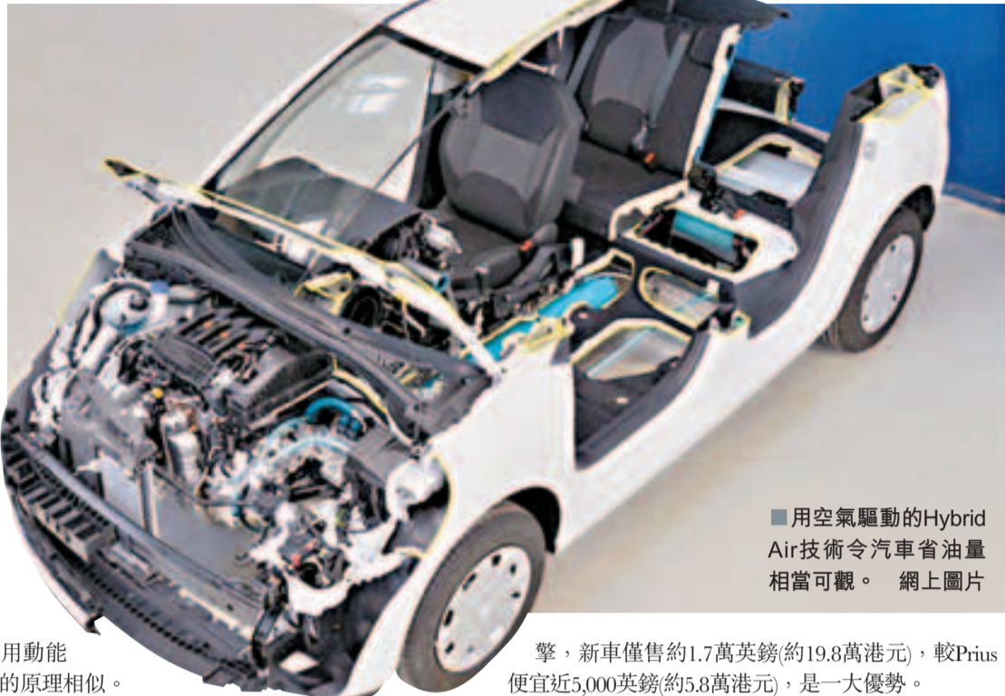
■用空氣驅動的Hybrid Air技術令汽車省油量相當可觀。

法國車廠標緻雪鐵龍在月中閉幕的2013年日內瓦國際車展，展出使用空氣作為引擎動力的Hybrid Air技術，被認為有潛力革新汽車市場。工程師指，新技術雖要搭配內燃引擎使用，但價錢相比豐田Prius等油電混能車便宜一大截，加上配件簡單和組裝容易，對中國、印度和俄羅斯等新興市場具一定吸引力，將於2016年投入生產。