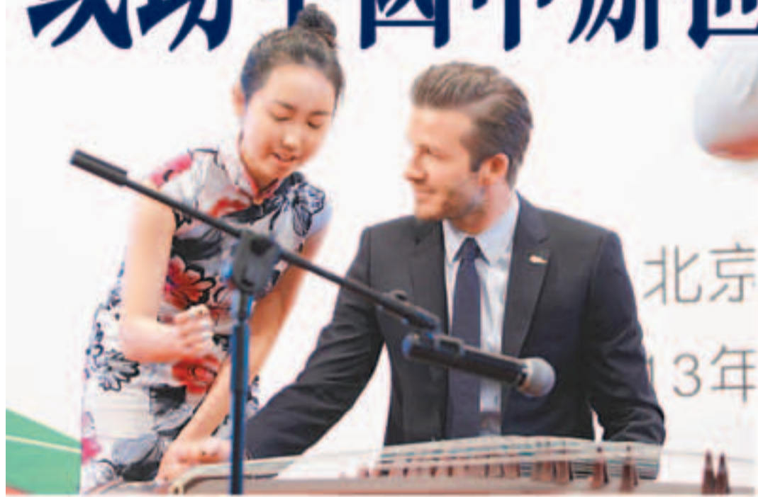
■碧咸在專家的指導下試彈古箏。