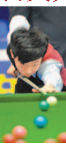
■呂昊天在卡輪晉級之後，首輪對手頭號種子奧蘇利雲因故退賽，所以幸運晉級16強，第二輪他6:5險勝戴爾之後，創紀錄的進入8強。