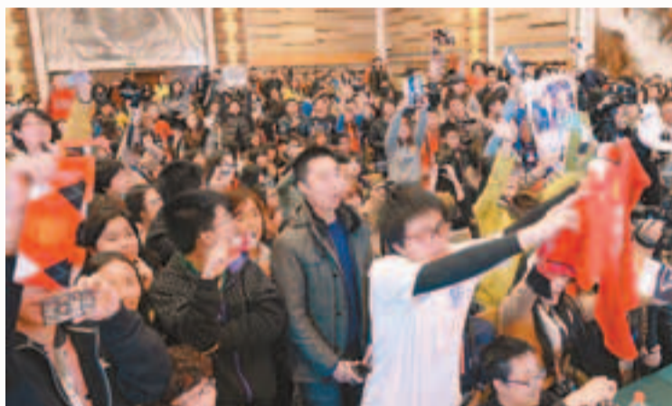
■北大學生為「萬人迷」而狂。