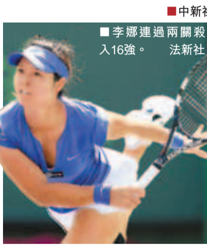
■李娜連過兩關殺入16強。

斯名將柏杜娃的對話中，鄭潔就以3:6、1:6敗下陣來。隨後的雙打比賽，她與克羅地亞選手盧比錫的跨國組合又以1:2遭遭「海峽組合」彭帥和謝淑薇逆轉，至此結束本次比賽全部征程。