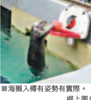
海獺入樽有姿勢有實際。