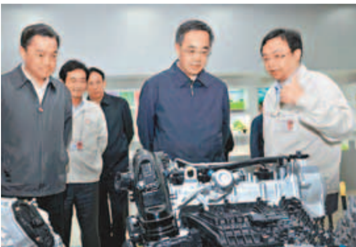
胡春華（右二）在惠州調研。

胡春華表示，地緣相近的潮汕揭三市可充分發揮歷史文化、僑鄉僑資、經濟特區、沿海區位、民營經濟發達等優勢，努力把潛在優勢轉化為經濟優勢，早日實現加快發展、振興粵東的目標。而毗鄰的惠州則可乘勢而上，堅持大項目帶動大發展，不斷提高發展的質量和效益，力爭成為珠