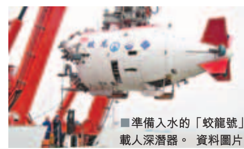
準備入水的「蛟龍號」載人深潛器。 資料圖片

據悉，2012年在夏威夷近海進行的演習有22個國家的40多艘艦艇參加。並非所有參與國都是美國的盟國，2012年演習的參與國包括俄羅斯和印度。五角大樓強調，中國從未參加過這項演習。