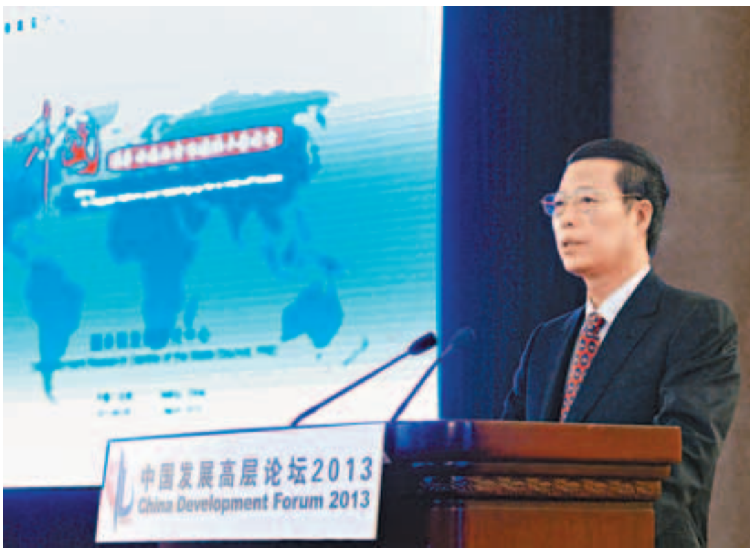
國務院副總理張高麗出席中國發展高層論壇2013年年會開幕式並致辭。

張高麗認為，未來改革，應從四個方面着手。第一，創新和完善體制、機制，「堅決減少對微觀事務的管理，重在向市場、向社會、向企業放權，在更大程度、更廣範圍發揮市場在資源配置中的基礎性作用。」第二，營造公平競爭的市場