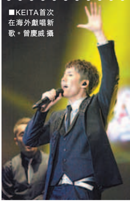
KEITA首次在海外獻唱新歌。