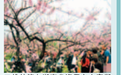
桃花節在湖南省資興市白廊鄉舉行,吸引四方遊客。

香港文匯報訊(記者 李程、樂國玉、通訊員 程來貴、李強輝 郴州報導)春滿東江湖,浪漫桃花島。2013年中國東江湖(白廊)桃花節日前在資興市白廊鄉舉行。來自全國各地上萬名遊客共赴桃花盛宴,百名桃花仙子亮相桃花節,在東江湖畔演繹浪漫的愛情故事。今年的桃花比往年開得更紅火,漫步湖岸,令人心曠神怡。桃花節舉行了盛大的開幕式、桃花運姻緣會、登島祈福等活動,將通過網絡、手機和現場投票等形式選出20名「桃花公主」和2名「桃花島島主」。據介紹,本次桃花節舉辦地白廊鄉,位於東江湖國家4A級景區內,有水域面積12萬畝,佔東江湖的一半,是已故著名女作家白薇的故鄉。