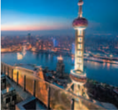
上海將採取更嚴格措施控制地下水開採。圖為上海夜景。

香港文匯報訊 據中新社報道,上海市水務局昨日對外披露,上海將採取更嚴格措施控制地下水開採。根據規劃,「十二五」期間,上海的河道水環境治理方向將從「消除黑臭、改善水質」,轉向「穩定水質、修復生態」;將以修復河道生態系統為主要任務,重點建設百條生態河道。據稱,上海市的地下水開採量已由歷史最高的1億立方米左右,下降到當前的1,000萬立方米左右,連續兩年實現「灌大於採」的良好局面。開採地下水被視為導致城市地面沉降的主因之一。資料顯示,上海從1860年開始開採地下水,從1965年起對地下水開採實行控制。目前採取的