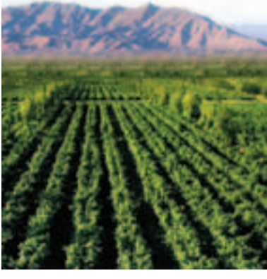
賀蘭山東麓葡萄酒產業莊園景觀。

香港文匯報訊(記者 王尚勇、張治、張雲 寧夏報導)《寧夏賀蘭山東麓葡萄酒產區保護條例》(以下簡稱《條例》)啟動儀式日前在張裕摩塞爾十五世酒莊隆重舉行。據了解,該《條例》是中國首部有關葡萄酒產區保護的法規,賀蘭山東麓葡萄酒產區也成為內地第一個進入依法發展的產區,該條例的實施,標誌著賀蘭山東麓葡萄酒產區已納入法制化的軌道。寧夏賀蘭山東麓葡萄酒產區地處寧夏黃河沖積平原和賀蘭山沖積扇之間,這是葡萄生長的天然沃土,擁有品質葡萄生長栽培的自然環境優勢,被公認為是世界最適合葡萄栽培及釀酒葡萄的地區之一,是中國最有潛力的葡萄酒產區。到2012年,寧夏葡萄酒種植面積達51萬畝,其中釀酒葡萄44萬畝。為了保護這一產區健康發展,