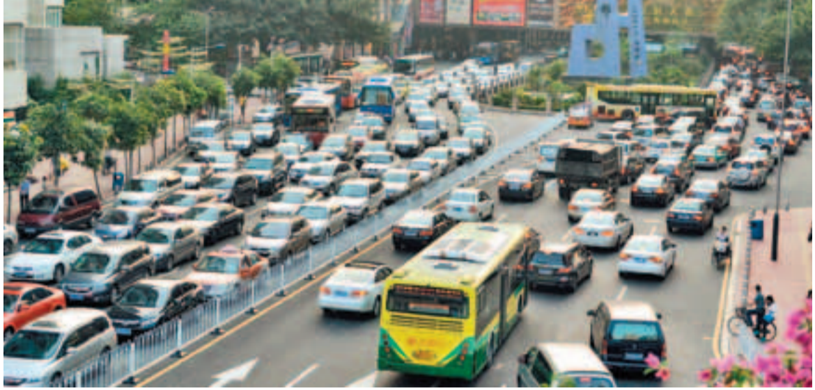
為舒緩市內塞車,繼北京、上海之後,廣州即將加入對外地車輛限行的行列。圖為廣州五羊村附近交通擠塞情況。

香港文匯報訊(記者 敖敏輝 廣州報導)繼北京、上海之後,廣州亦即將加入對外地車輛限行的行列。廣州市交委日前正式公佈非本市籍載客汽車交通管理措施,根據初步方案,工作日早晚交通高峰時間禁止外地車在中心城區通行,同時,工作日白天部分高架路段和部分主幹道亦禁止外地牌車輛通行。據悉,廣州市「交通限外」措施4月中旬一旦經過聽證正式出台,外地車擅闖「禁區」,將被處以200元(人民幣,下同)、扣3分的處罰。