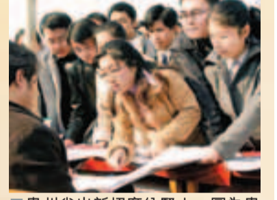
貴州省出新招廣納賢士。圖為貴州省日前舉行的招聘會。資料圖片

香港文匯報訊(記者 路曉寧 貴陽報導)貴州省日前發佈的《貴州省引進高層次人才住房保障實施辦法(試行)》(以下簡稱《辦法》),規定從省外、國外引進到貴州省機關、企業事業單位工作的高層次人才可享受住房保障,最高購房補貼達100萬元(人民幣,下同)。