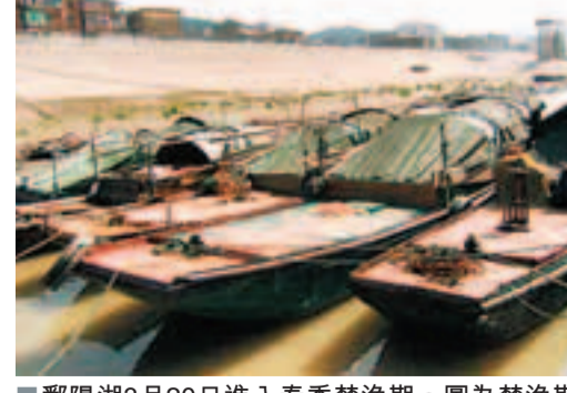
鄱陽湖3月20日進入春季禁漁期。圖為禁漁期停靠的漁船。

香港文匯報訊(記者 陳融雲、吳文倩 江西報導)江西省鄱陽湖及長江江西段禁漁暨增殖放流啟動儀式日前在南昌舉行,這也標誌著中國最大淡水湖鄱陽湖正式進入為期3個月的春季禁漁期。另據,在禁漁期內,江西將在鄱陽湖投放大約3億尾的魚苗。據悉,從2002年起,鄱陽湖開始實行全湖範圍禁漁制度,在每年3月20日12時至6月20日12時的禁漁期內,禁止所有捕撈作業。今年是鄱陽湖實行禁漁制度的第12年,此次春季禁漁區域範圍包括鄱陽湖湖體水線及贛江、撫河、信江、修河、饒河「五河」幹流入湖口。此外,從4月1日中午12時到6月30日中午12時,包括長江江西段在內的整個長江西段也都將禁漁。另據,在禁漁期內,包括鄱陽湖在內的江西全境還將投放大約6億尾的魚苗,其中一半以上投進鄱陽湖。