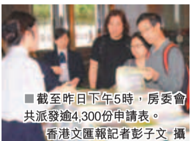
截至昨日下午5時,房委會共派發逾4,300份申請表。

香港文匯報訊(記者 王維實)房屋委員會推出832個居屋貨尾單位,昨天開始派發申請表,是次出售的單位包括受短樁問題影響的天頌苑單位,但依然受歡迎,有市民指不擔心部分單位長時間空置,會影響樓宇質素,最重要是有屋住;另有市民指早前申請免補價的二手居屋落空,希望再試運氣;又有父母為子女張羅,排隊取表。房委會