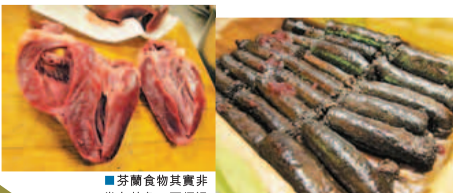
■芬蘭食物其實非常有特色，要經過細味才能吃出食物中的層次感。

逢星期二晚上九時於TLC旅遊生活頻道播放（有線電視54台、now寬頻電視213台、bbTV 317台）。