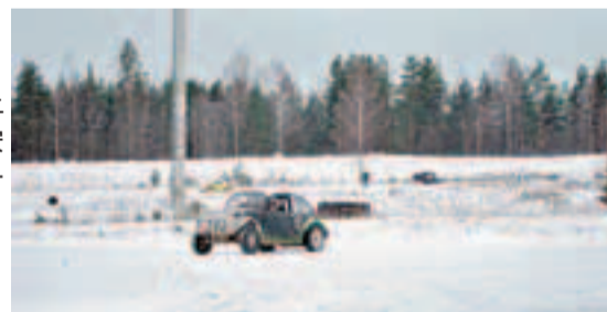
■在光滑的冰面上賽車，車子不能安裝雪胎或雪鏈，十分刺激危險。