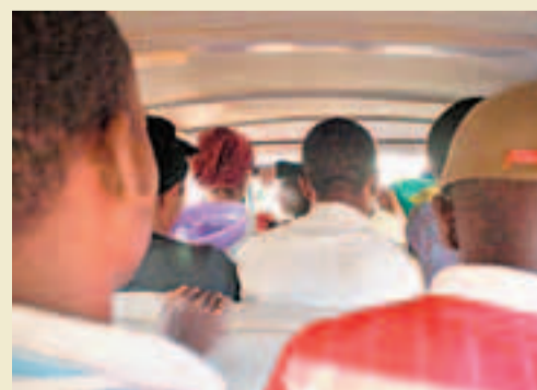
■很難想像一輛小型貨車竟可坐23人！

非，管理還算可以。一輛香港客貨車能坐15人已經非常厲害，不過一山還有一山高，在這裡一輛小型客貨車竟可以坐多達23人，非常不可思議，還有空間容下數個手抱嬰孩，一堆活雞鴨鵝，一籃臭鹹魚和兩個大背包，可見當地人很懂一寸空間一寸金的道理！