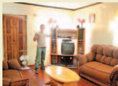
■Khama家已算是村中家境不錯的家庭。