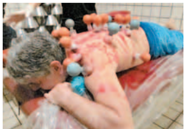
■血淋淋的傳統拔罐，乍看之下讓人十分恐懼，事實上只不過把壞血都吸出來。

芬蘭人給人的印象很強悍，強悍得足以擊退納粹和蘇聯人的入侵。他們能夠忍受寒冷嚴酷的氣候，度過一個個漫長陰鬱的冬天，因為當地可以放肆飲酒的夏日短得可憐。但也因為這個原因，被稱為「懷爐」的克斯肯可瓦特加（Koskenkorva Vodka）得以成為芬蘭國民的飲品。