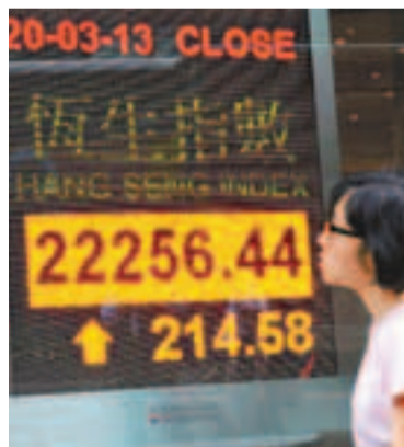
港股昨一度失守二萬二關，收市倒升214點，結束3連跌，成交764億元。新華社

香港文匯報訊(記者 周紹基)塞浦路斯國會否決向存戶「開刀」的徵稅議案，改向俄羅斯求救，外圍股市回穩，A股現反彈，加上大摩唱好，港股終於結束3連跌。恒指開市雖一度失守二萬二關，但很快便回升，全日反彈214.58點，報22,256點，成交額764億元。內銀股領漲，令國指大幅跑贏恒指，大升238.7點或2.2%報10,978.7點。有分析員指，大市缺乏中線利好消息，加上沽空額大，相信港股升勢難持續，料於22,600點前遇阻。