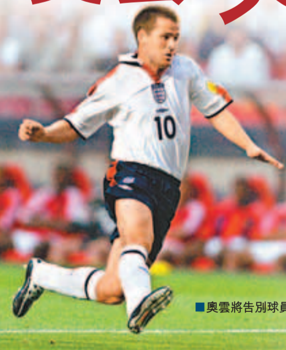
■ 奧雲將告別球員生涯。

踢過利物浦、皇家馬德里、紐卡素、曼聯的英格蘭球星奧雲日前宣布將於今夏與史篤城約滿後正式掛靴，他在Twitter上感謝向他送上祝福的球迷：「我十分感動，很多美好的祝願，我決定退役已有一段時間，原本以為不會怎樣……卻忍不住流淚了。太太也覺得我怪，其實我很少哭。」