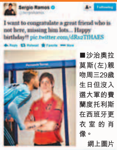
■ 沙治奧拉莫斯(左)親吻周三29歲生日但沒入選大軍的費蘭度托里斯在西班牙更衣室的肖像。網上圖片