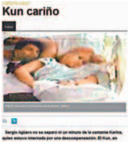
■ 阿古路甜妻「床照」曝光。網上圖片