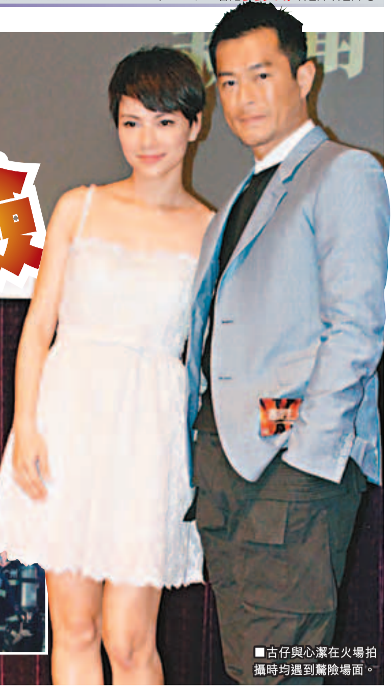
古仔與心潔在火場拍攝時均遇到驚險場面。

廣州消防部門大力配合 此外，《逃出生天》曾先後在泰國和廣州取景，而廣州拍攝一站，劇組在商業中心封街拍攝，更獲當地消防等部門大力協助，派出近25部消防車和救護車等作真實背景，並有過百消防和醫務人員協助拍攝，場面壯觀。 電影《逃出生天3D》在廣州封街拍攝。