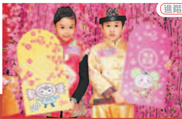
港孩的利是錢普遍過千元。資料圖片

利是作爲過年禮物的一種特殊形式,若能加強人們對其服務社會功效的認識和行動,則可避免孩子鋪張浪費和炫耀攀比的心態,更好地讓他們學習奉獻和善用錢財的觀念。