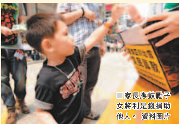
家長應鼓勵子女將利是錢捐助他人。資料圖片

從社會學角度而言,人的消費慾望和需求水準,不但受到收入影響,且也受到社會因素影響。隨着子女數目的減少和人們生活水平的提高,家長對孩子的溺愛程度越來越大,無論經濟上或心理上,都會給孩子無限量滿足。但實際上,過分溺愛和缺乏正確的教育引導,會令子女形成不良心理。當前不少子女對金錢觀念存在錯誤認識,攀比和追求名牌已成爲一種風氣,如將利是用於娛樂消遣也導致不少浪費。